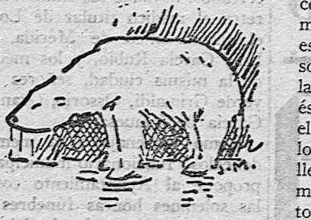
Para transportes, "LEGIDO"