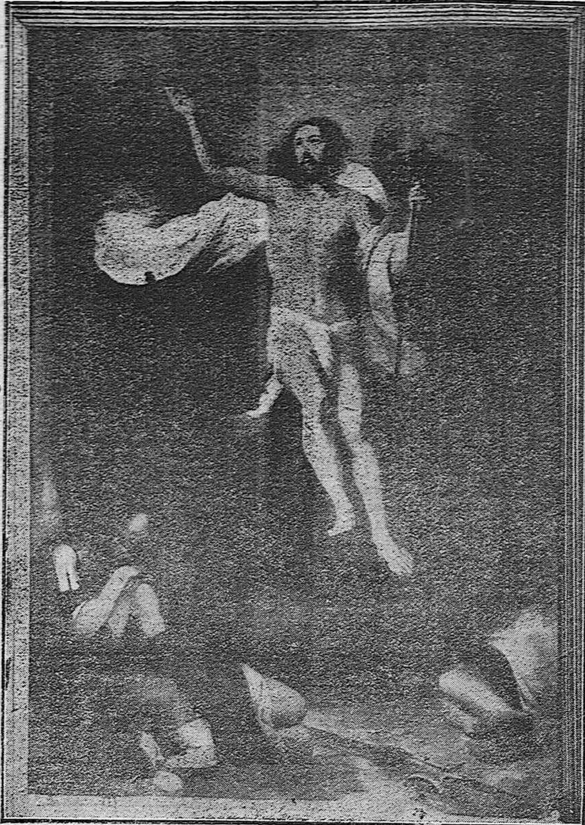
LA RESURRECCION.—Célebre cuadro del inmortal MURILLO, que se conserva en la Academia de Bellas Artes de San Fernando (Madrid)

La mencionada obra fue muy del agrado de la aristocrática concurrencia que ayer llenó el salón de nuestro teatro.