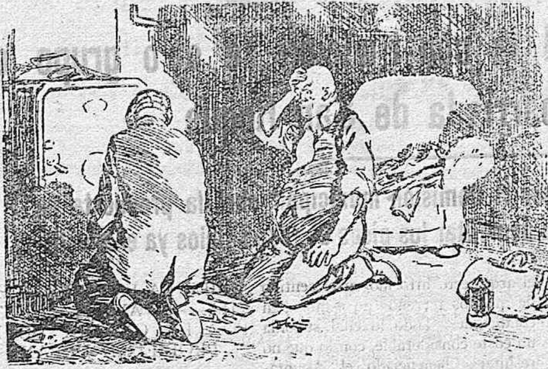
El ladrón.—Si los jueces supieran el trabajo que cuesta robar, serían mucho más benignos con nosotros en sus condenas.

Estas medidas han de remediar el mal endémico de tantos hoteles españoles impropios de ese nombre. Pero en tanto, convendría que las autoridades se fuesen ocupando de esta cuestión que tanto afecta a Badajoz. Tal vez lo más conveniente fuese—aparte de la labor realizable con los hoteles de Badajoz para su adecentamiento, limpieza y comodidades—trabajar para conseguir el establecimiento en nuestra ciudad de un nuevo hotel con los requisitos precisos, y de no ser esto factible, el de una hospedería o residencia—se nos viene a los puntos de la pluma la Residencia de Artistas, en Toledo—, instituciones ya existentes también en otras poblaciones españolas.