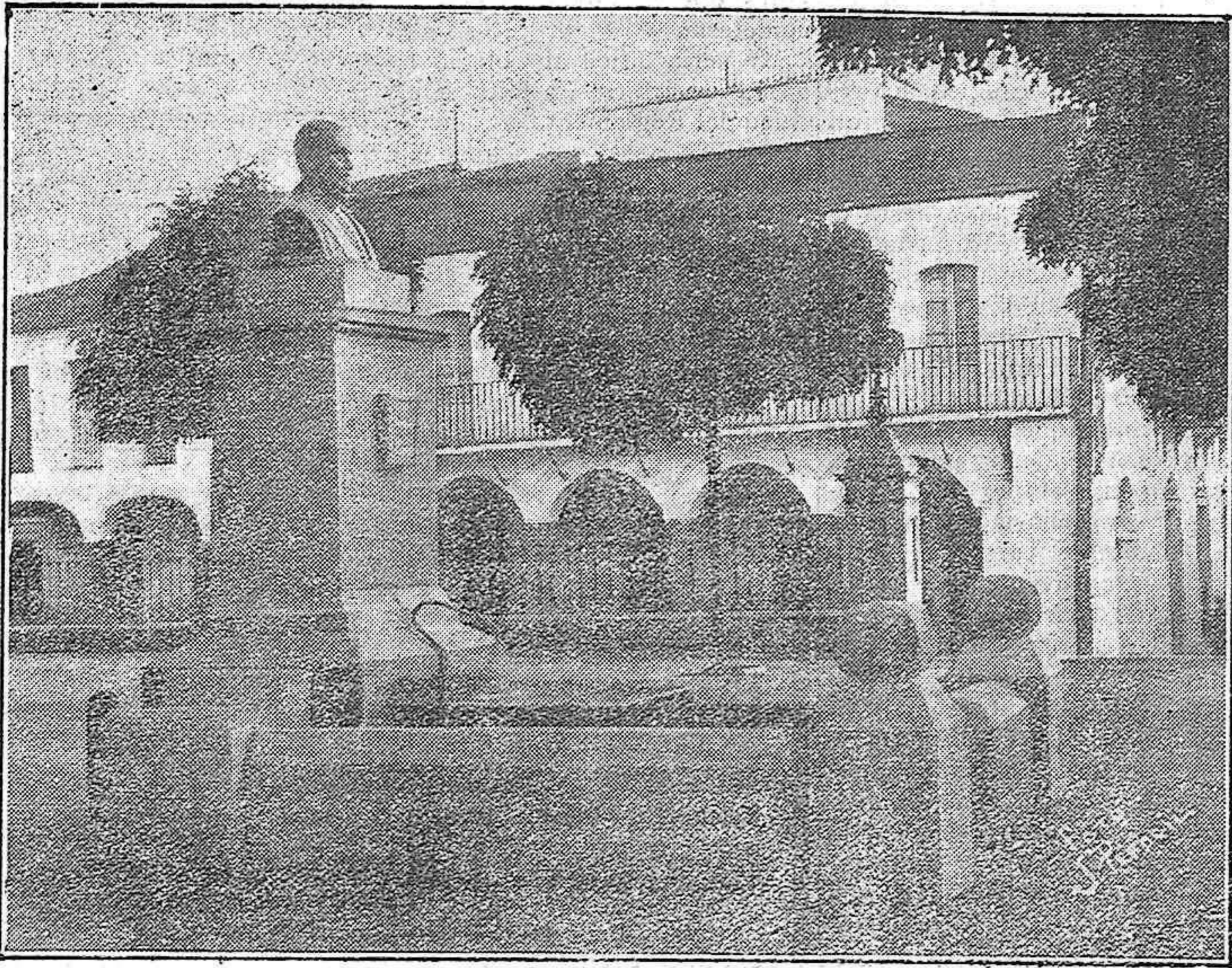
Monumento a Arias Montano, de granito y bronce, debido a la inspiración de Granero y Hermoso, que ha sido colocado en Fregenal de la Sierra

En la Exposición de Arte recientemente celebrada en Fregenal con motivo del IV centenario de Arias Montano, han figurado inspiradas producciones de un artista modesto, inteligente y laborioso, cuyo nombre sirve de epígrafe a estas líneas.