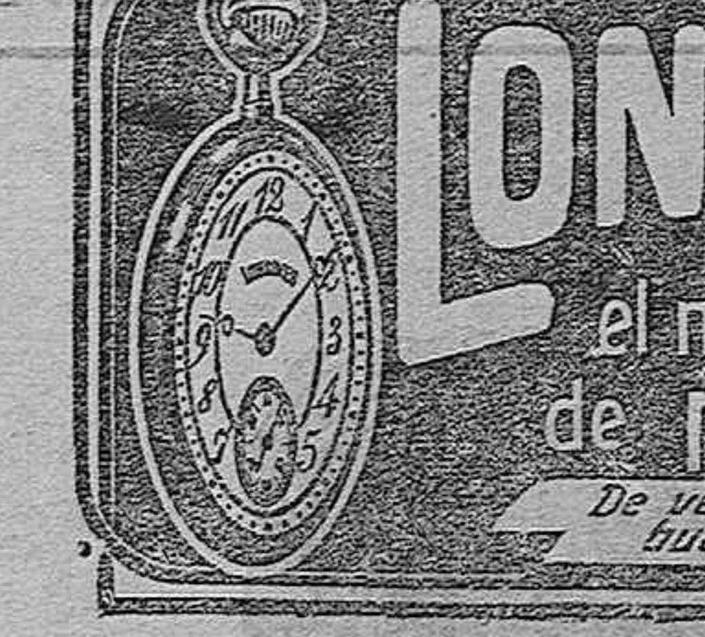
VENTAS AL POR MAYOR Y MENOR. DESCUENTOS, SEGUN LA IMPORTANCIA DEL PEDIDO.

Ventas al por mayor y menor. Descuentos, según la importancia del pedido.