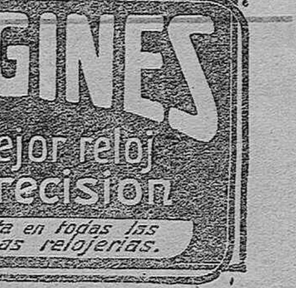
VENTAS AL POR MAYOR Y MENOR. DESCUENTOS, SEGUN LA IMPORTANCIA DEL PEDIDO.

Ventas al por mayor y menor. Descuentos, según la importancia del pedido.