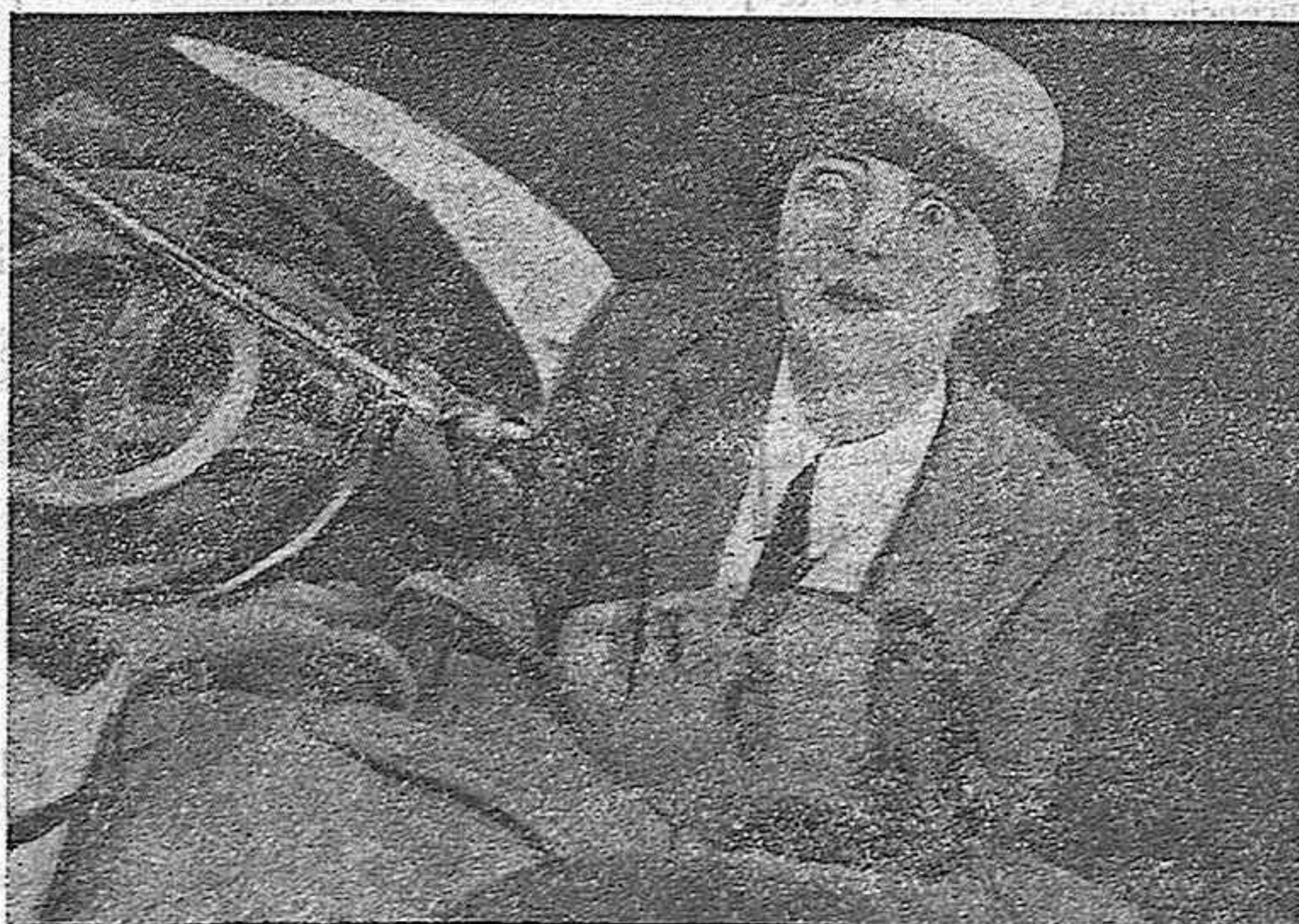
Una insuperable expresión trágica de DOROTY MACKAILL. El actor FORBES agonizando en brazos de la genial artista y el automóvil destrozado, contribuyen a prestar impresionante realismo a la escena.