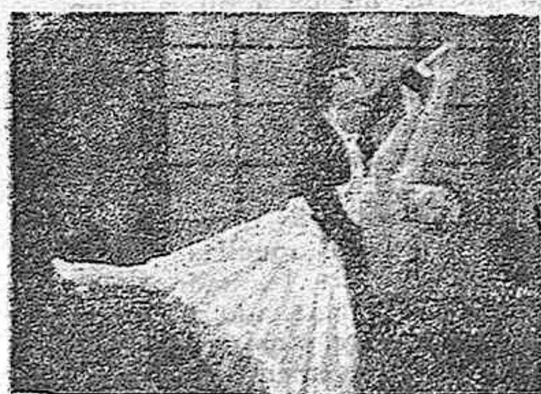
Una escena de la famosa película "Ramona"

Gary Cooper.—"Estos directores son unos bandidos. Qué empeño en acortar las escenas que debo hacer con Lupe Vélez..."