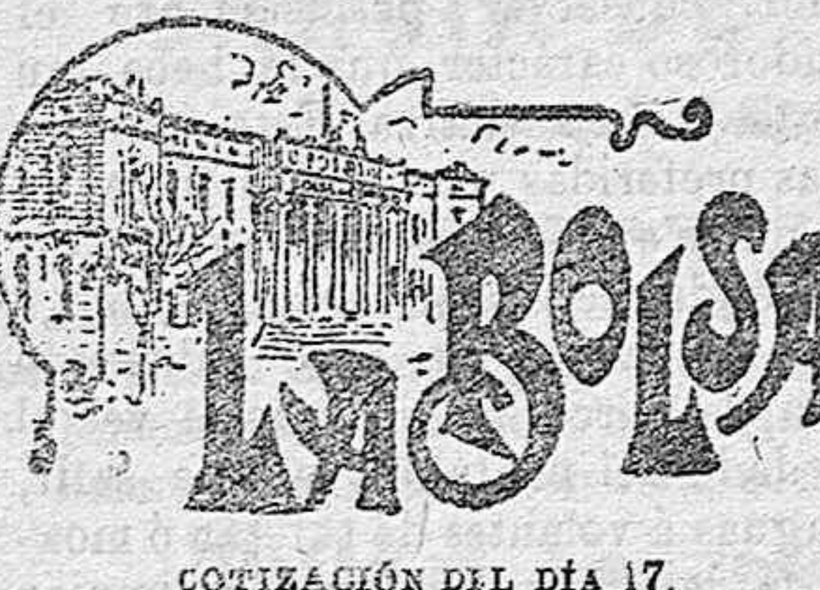
COTIZACIÓN DEL DÍA 17.