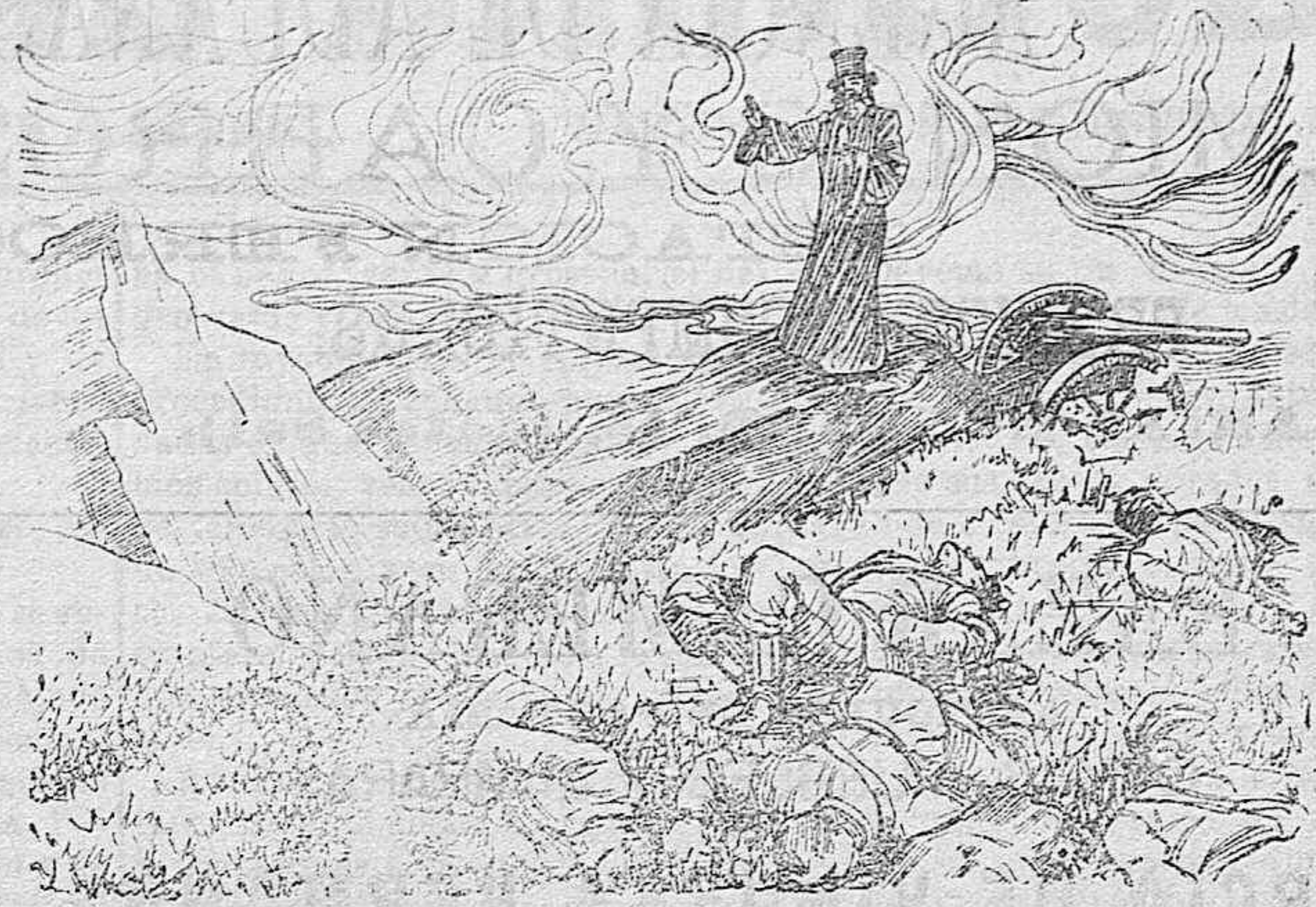
Sacerdote ruso bendiciendo á los muertos después de una batalla.