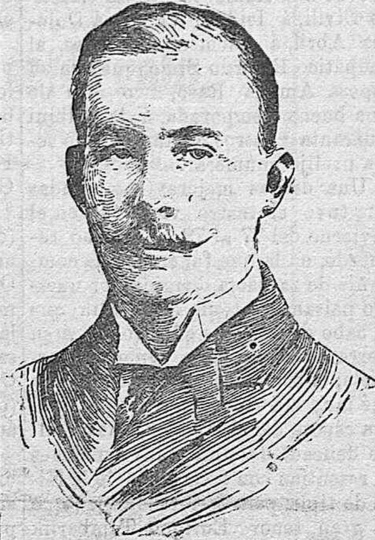
El príncipe Jorge de Grecia.

Si por su juventud, inteligencia, elevados sentimientos y habilidad de gobernante no mereciera nuestras simpatías el príncipe Jorge de Grecia, bastaría para ser acreedor á ellas la misión que en aras de la justicia le hace recorrer las grandes capitales de Europa: redimir definitivamente del yugo otomano la isla de Creta.