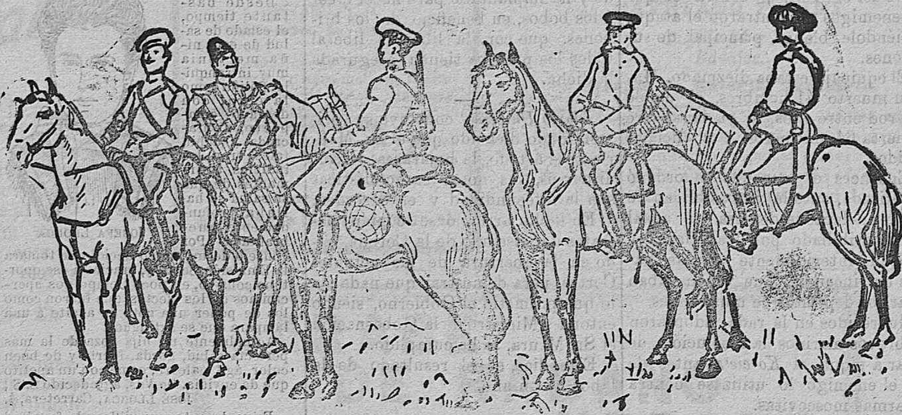
Hulano. Cosaco del Ural. Soldado de la Guardia. General. Oficial de Cosacos de Amur.

Hay que venir á la producción del alcohol industrial, hay que venir en ello; para esto no hay otro recurso que dejar libre esta industria en los comienzos, eximiendo de impuestos á las primeras materias y conservando el impuesto sobre el producto rectificado, á una graduación determinada, en cuyo caso sólo podrá venderse.