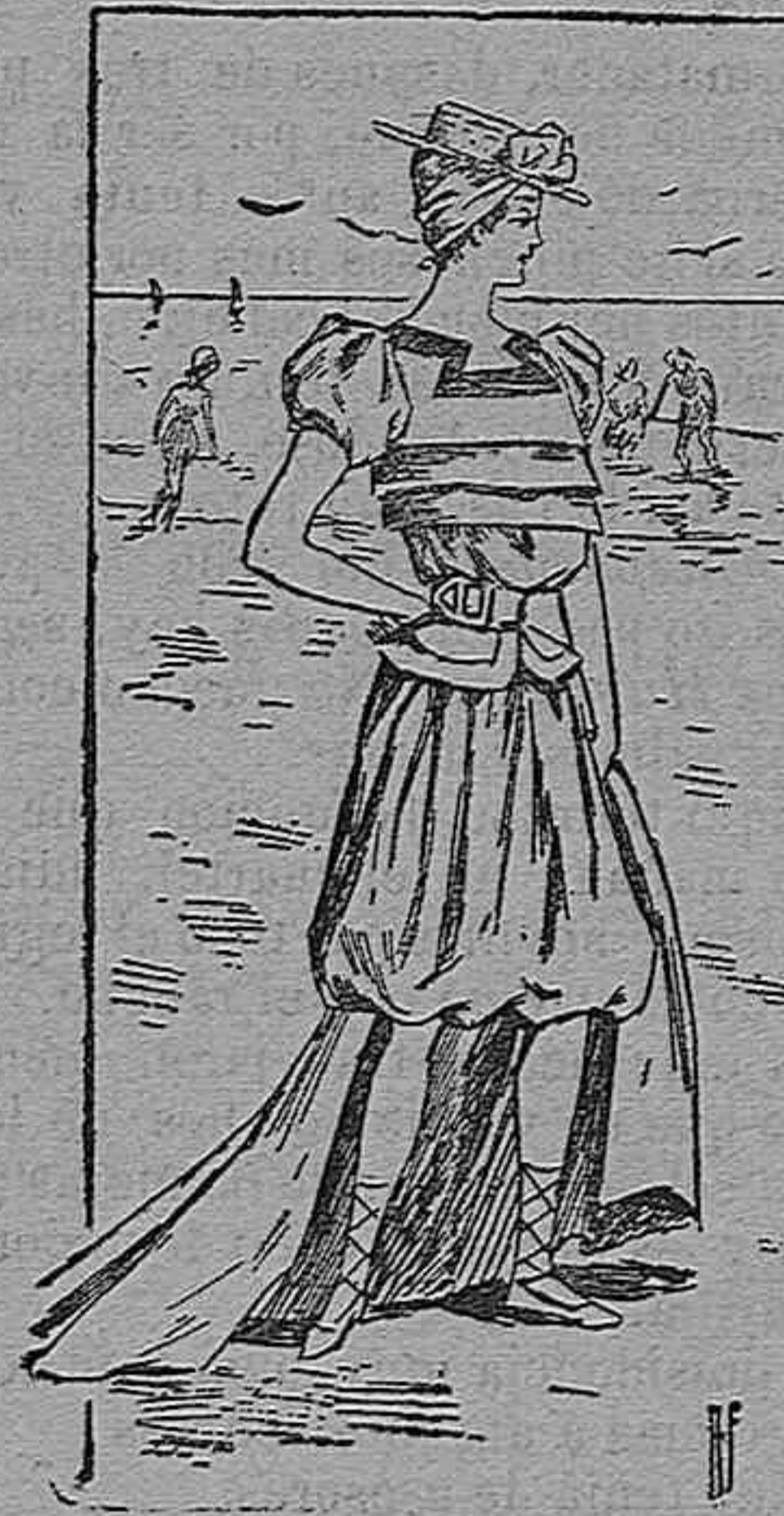
Traje para baño.

Modelos exclusivos para nuestras lectoras, de los grandes almacenes de EL SIGLO, Barcelona (1).