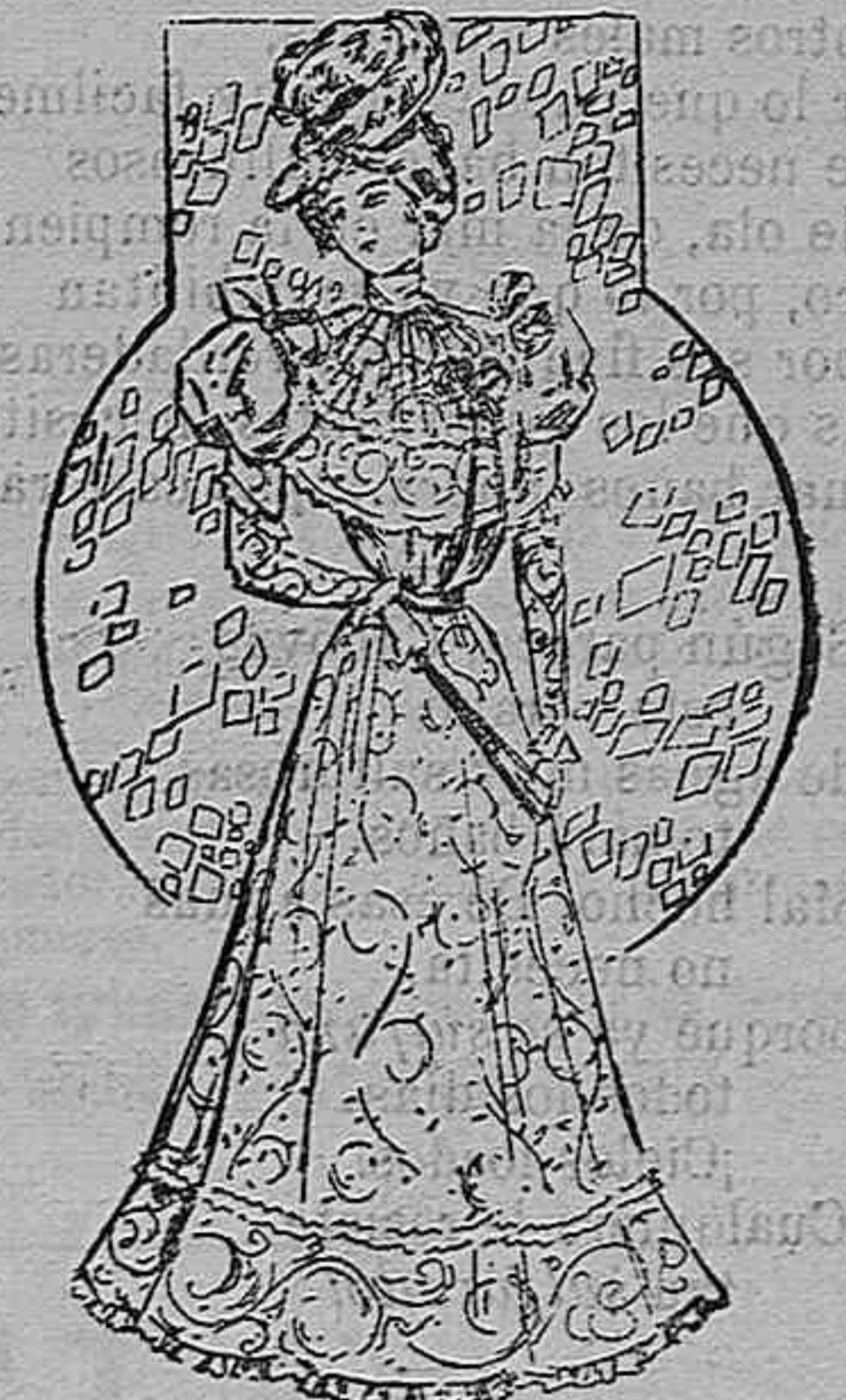
Traje para visita.

De crespón chine. Cuerpo ajustado con fichú «María Antonieta», adornado el borde con un galón y abierto sobre un cami solin de seda; corbata también de seda; mangas al biés y falda de seda, cubierta con tres volantes de crespón, adornado en el borde.