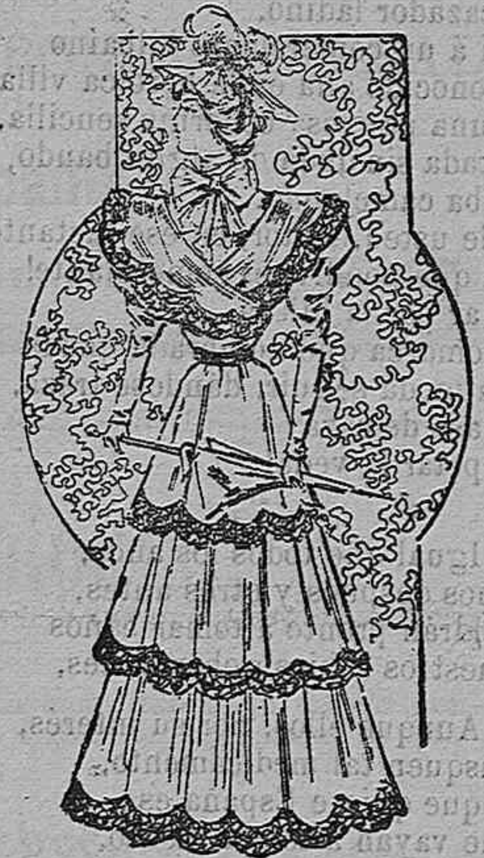
Traje para paseo.

Modelos exclusivos para nuestras lectoras, de los grandes almacenes de EL SIGLO, Barcelona (1).