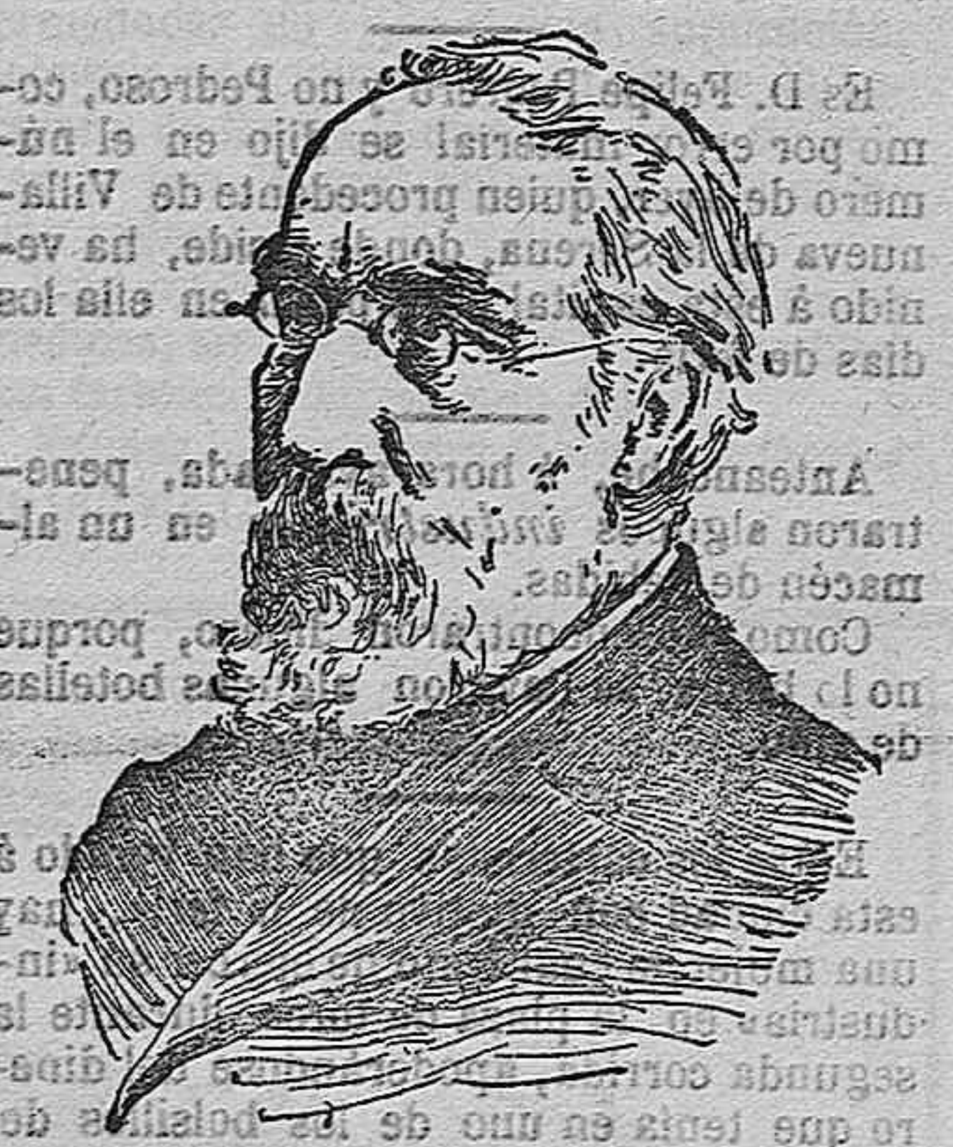
D. Francisco Pi y Margall

Muchas gracias; y guarde el Amadeo que ya recogeré la vuelta otro día. Es más probable que usted necesite hoy mismo los veinte céntimos que yo el duro.