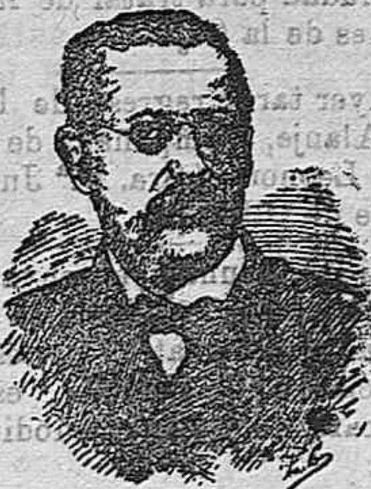
José Anselmo Clavé