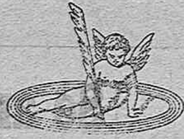
Marca de fábrica depositada

está depositada con arreglo á lo que marca la ley y pertenece solamente á nuestra casa: no, es pues, la denominación de las máquinas parlantes ó fonógrafos, sino que se aplica especialmente á nuestro apa-