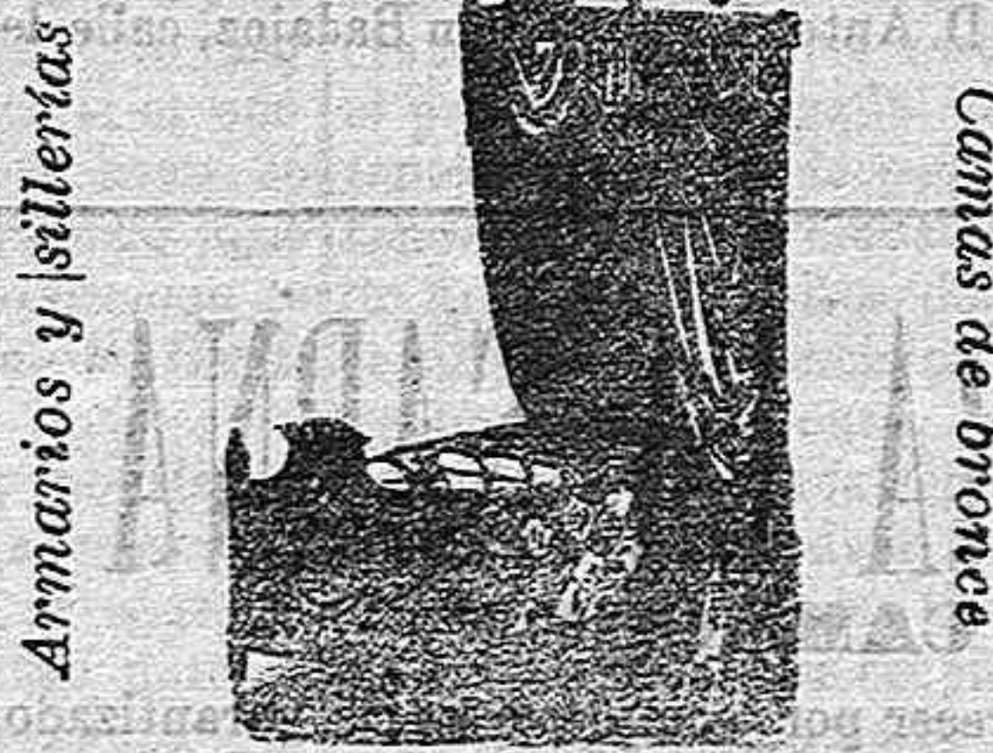
Armarcos y sillenteras