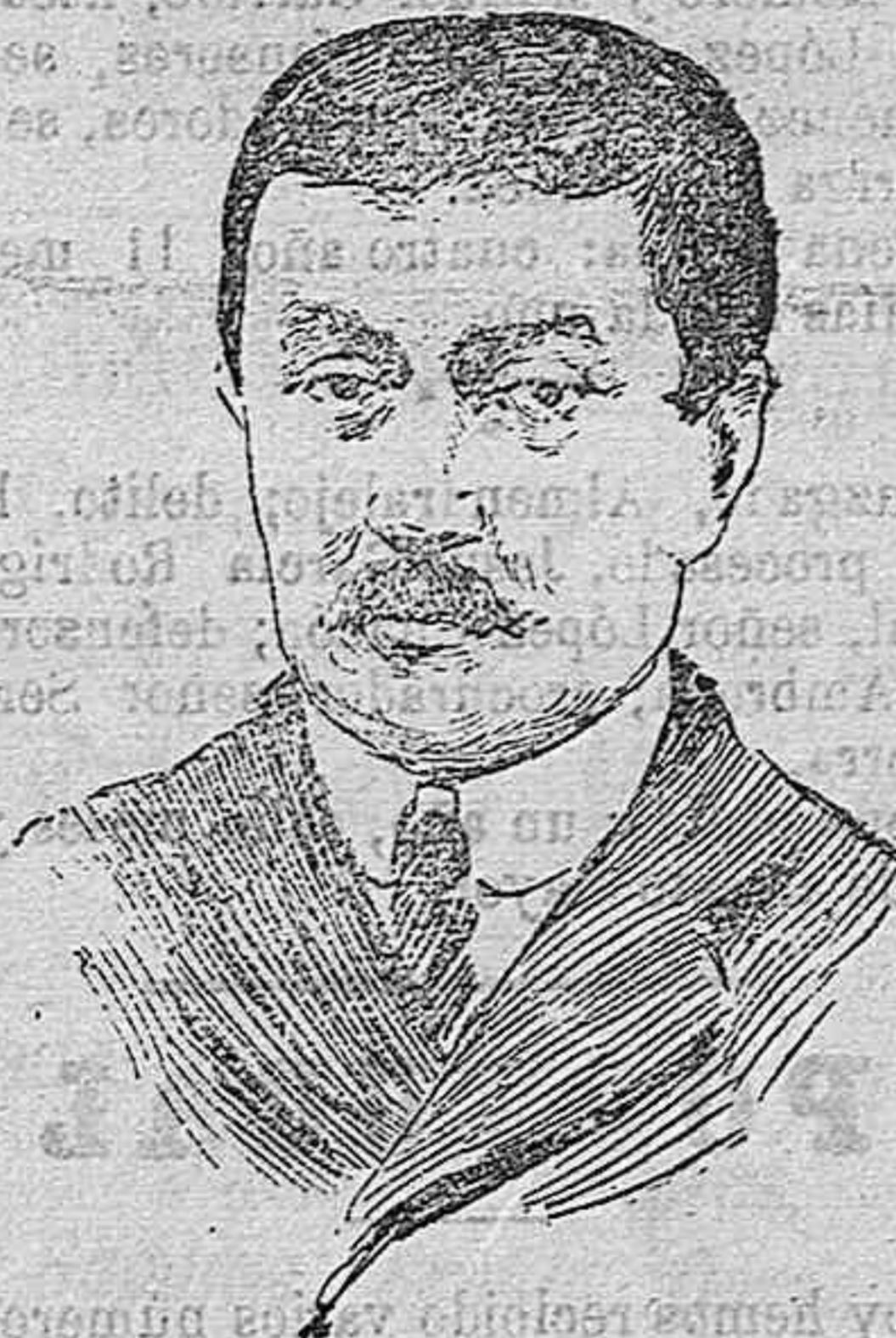
MONSIEUR PAINLEVÉ, presidente del nuevo Gabinete francés.

Todo lo que se había contado de disfraces, de huidas, de abandonos, de haberse ido de Barcelona hace tiempo, es completamente falso.»