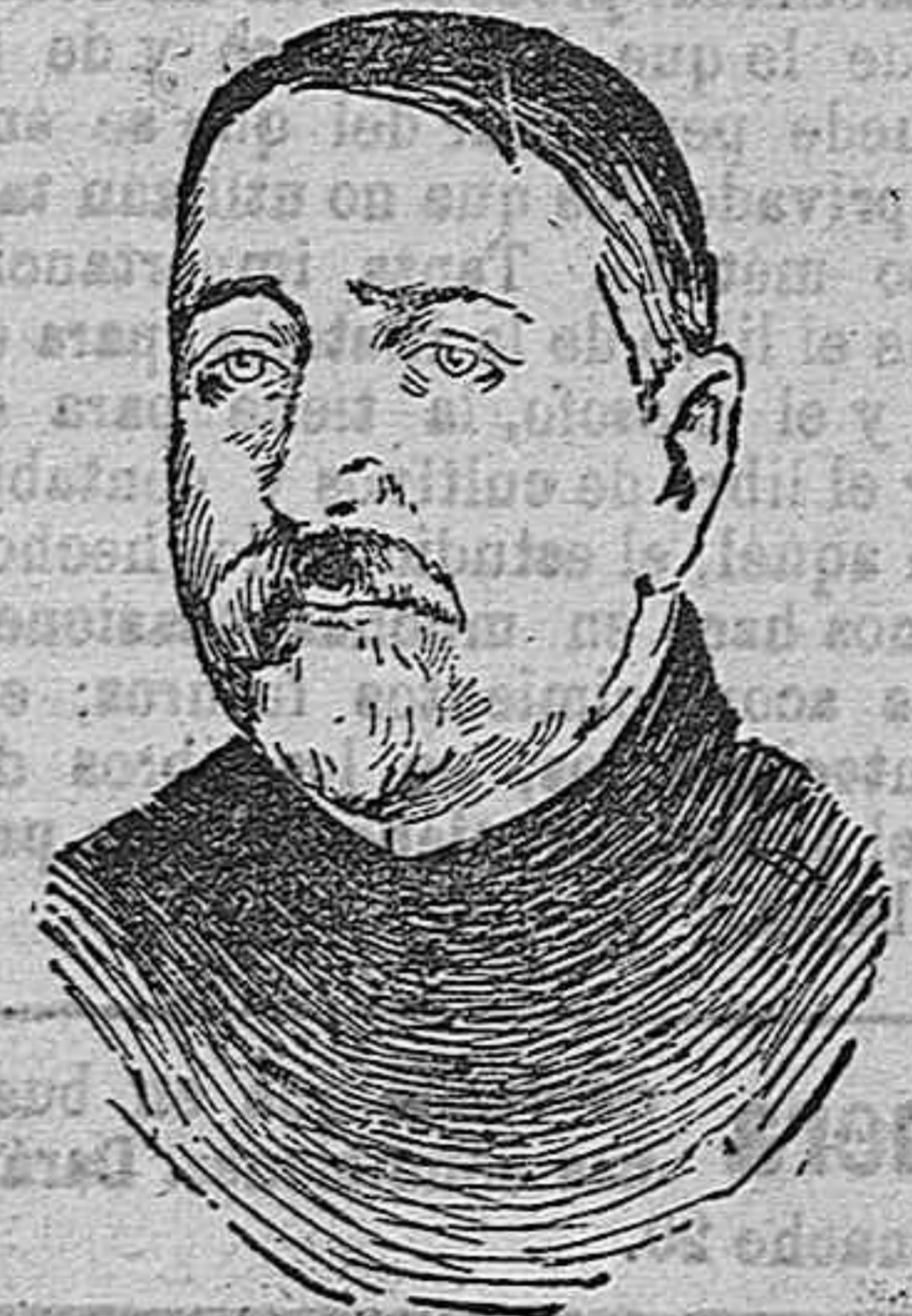
El general Leblois que manda una división en la región de Monastir