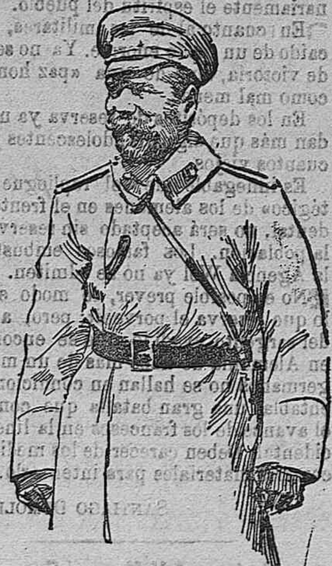
EL EX-ZAR DE RUSIA, NICOLAS II

Más... ¡oh desengaño!, en aquel pueblo solamente le esperaba con ansia una