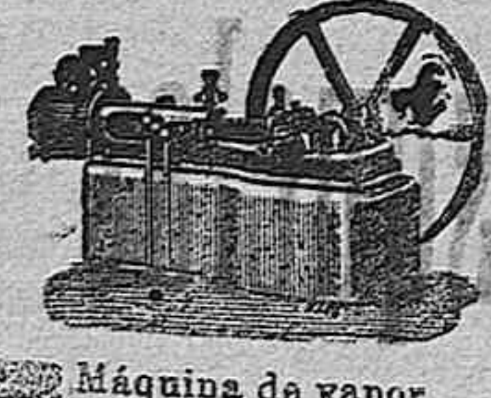
Máquina de vapor horizontal.