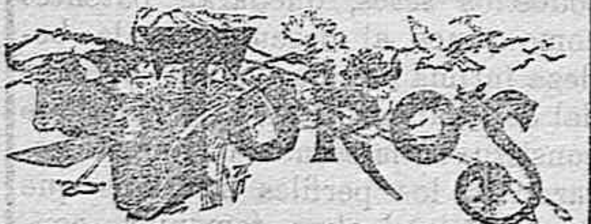
El festival del domingo.

No hay dolor que resista la Thermo-Sabina Camacho.