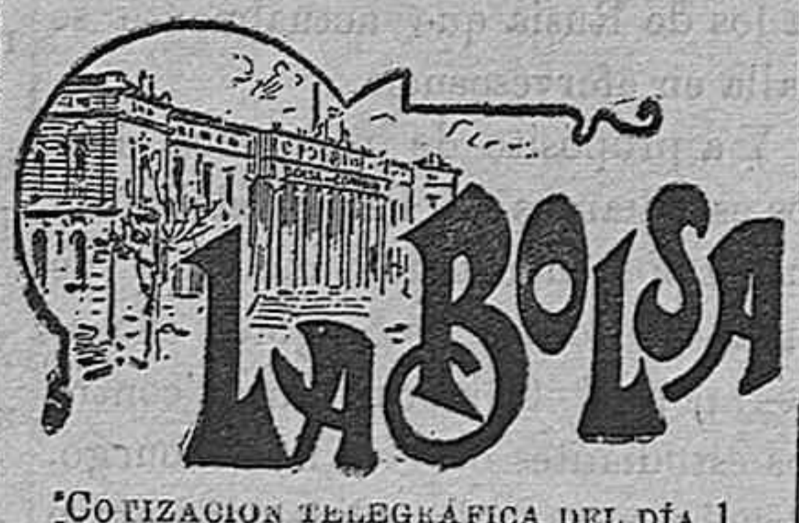
COVICACION TELEGRÁFICA DEL DÍA 1

Zafra, trigo 14 pesetas fanega; cebada, 7'50; habas, 11; avena, 5; chicharros, 11'25; garbanzos duros, 17; blandos, 21; aceite, 11'75; vino, 3'50; carne de cerdo, 11.