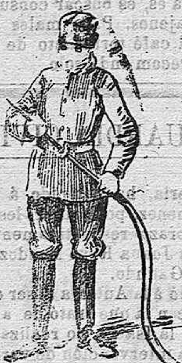
Escofandra para bomberos.

Durante estos últimos años los adelantos en el material destinado a la extinción de incendios han sido tales, que para a ganos países como, por ejemplo, Inglaterra, lo que antes constituía una gran calamidad, al iniciarse un incendio, no pasa de ser hoy un accidente de más ó menos importancia, relativamente fácil de combatir.