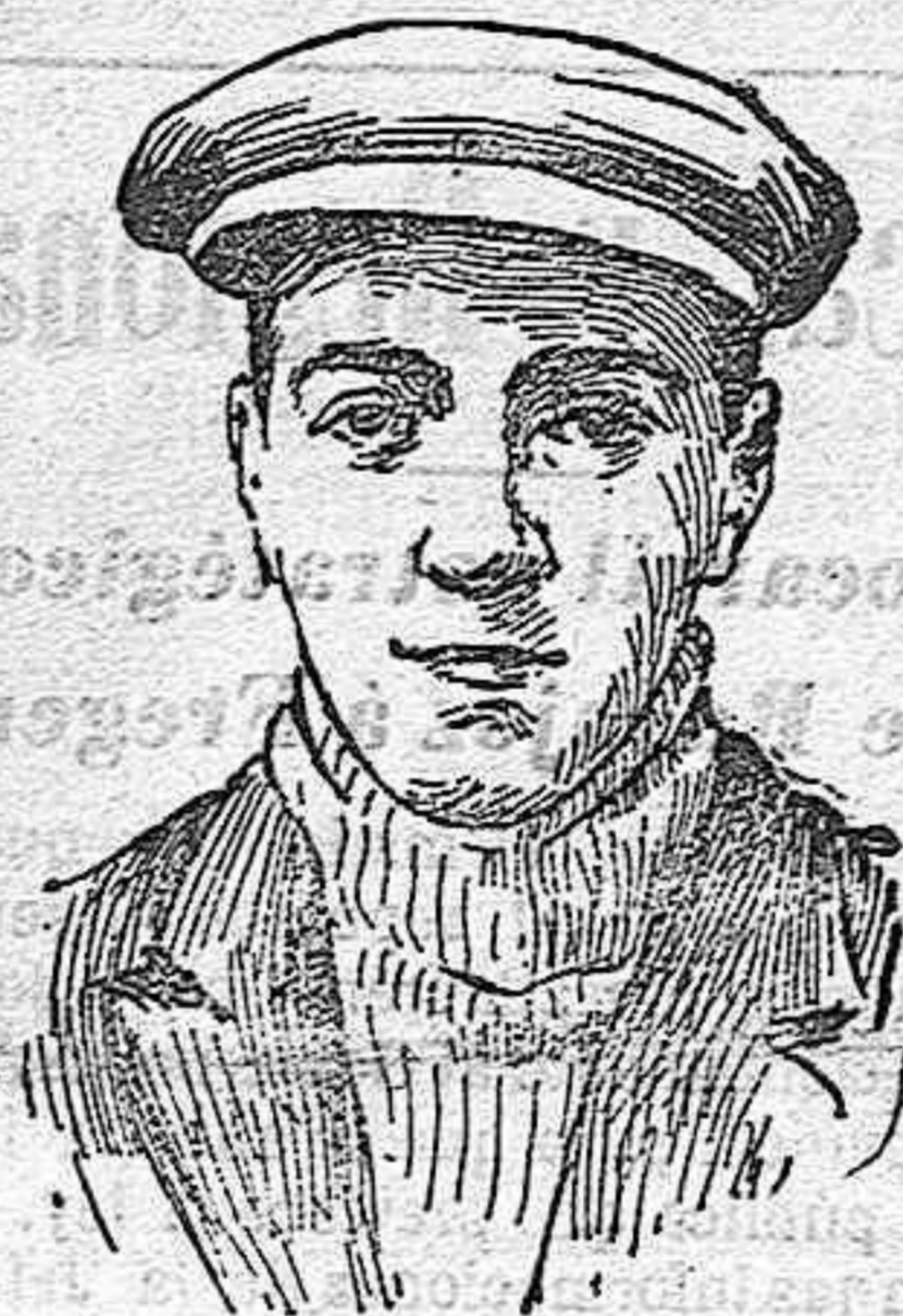
El aviador Perreyón, que elevándose á 6.000 metros ha batido el record de altura.