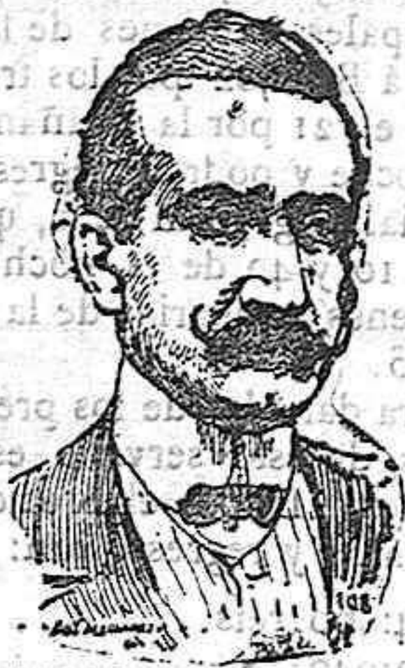
D. Natalio Rivas.

La personalidad del diputado por Granada, elegida por el Sr. Moret para desempeñar la Subsecretaría de la Presidencia del Consejo de Ministros, está bien definida entre los madrileños. Hombre modesto, sus méritos, que son muchos, no han podido trascender afuera, porque, las bondades de su corazón generoso y las exquisitices de su alma, abierta á todo lo grande, cualidades que requieren el contraste del trato diario para ser bien estimadas.