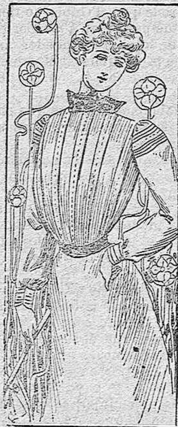
BLUSA PARA SENORITA

Modelos exclusivos para nuestras lectoras de los Grandes almacenes de EL SIGLO, Barcelona