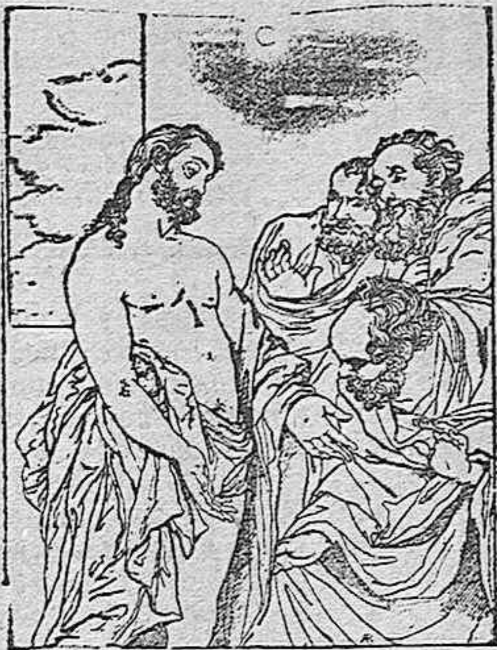
Jesucristo apareciéndose á Santo Tomás.

Para apreciar el asunto de este lienzo hay que tener presente el texto del capítulo XX del Evangelio de San Juan. En él se dice que, habiéndose aparecido Jesús por segunda vez á sus apóstoles, después de su muerte, llamó á Tomás que se hallaba entre ellos, y reprochándole su incredulidad, hizo que pusiera aquél la mano en la hendidura de los clavos con que le habían martirizado, para convencerle de su resurrección.