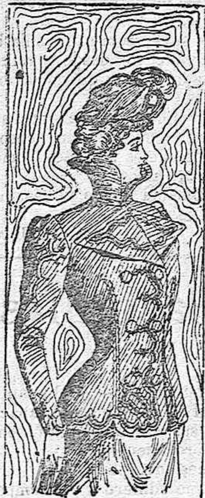
Chaqueta para paseo.

Modelos exclusivos para nuestras lectoras de los grandes almacenes de EL SIGLO, Barcelona.