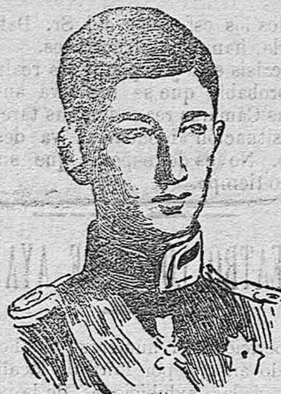
El príncipe Boris heredero del trono de Bulgaria, que se ha puesto al frente de tres ejércitos encargados de acertar el camino entre Nich y Salónica.