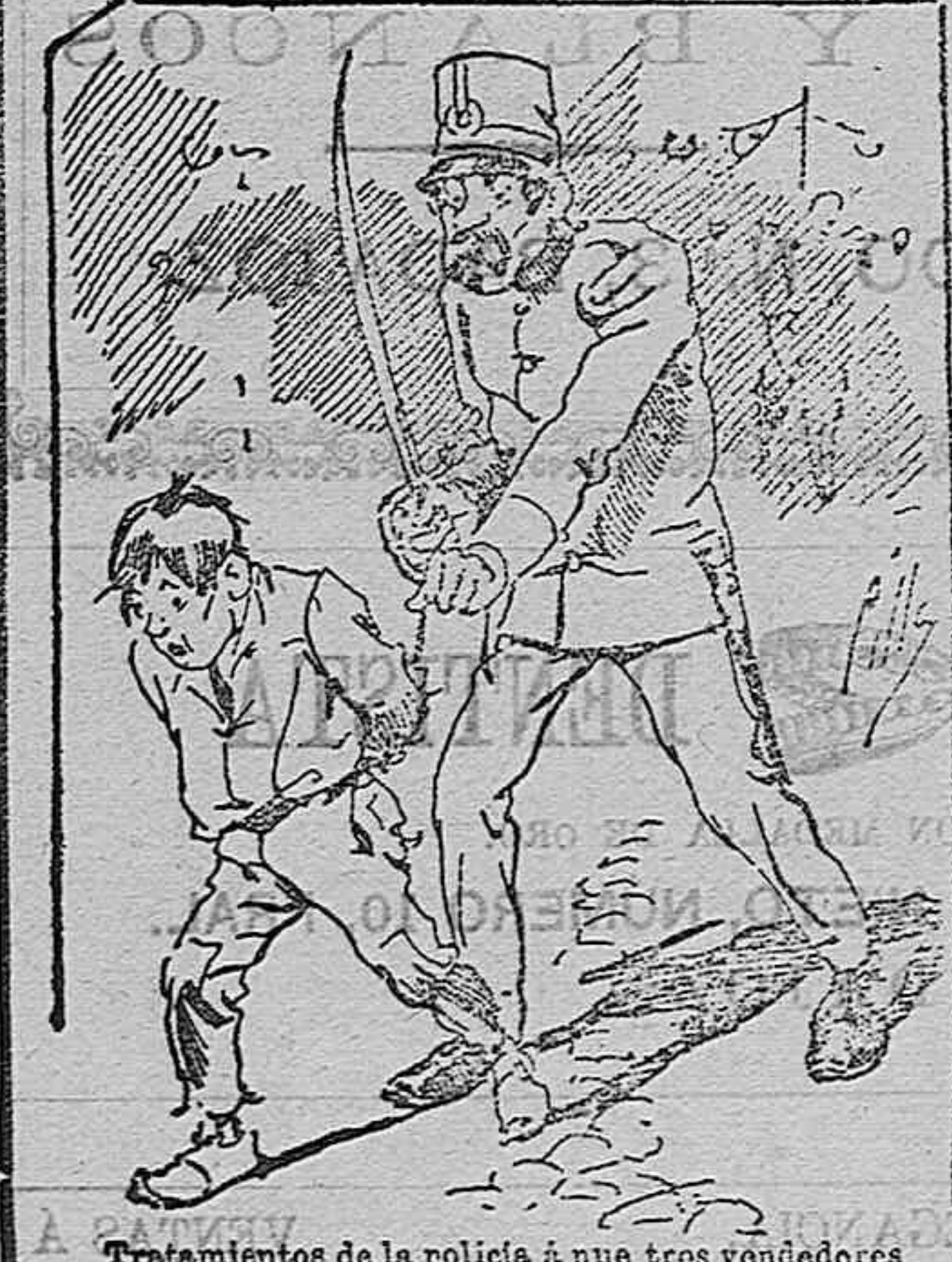
Tratamientos de la policía á nue tres vendedores cuando el número pica.....