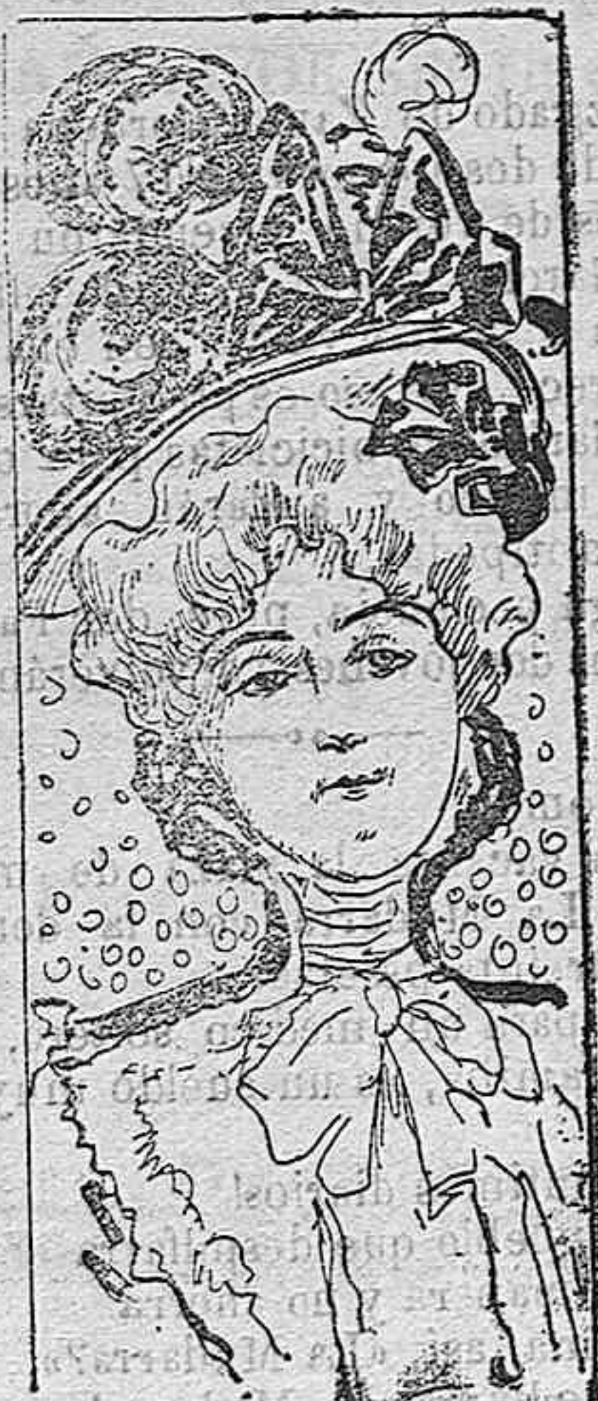
Sombrero para señoritas.

Modelos exclusivos para nuestras lectoras, de los grandes almacenes de EL SIGLO, Barcelona.