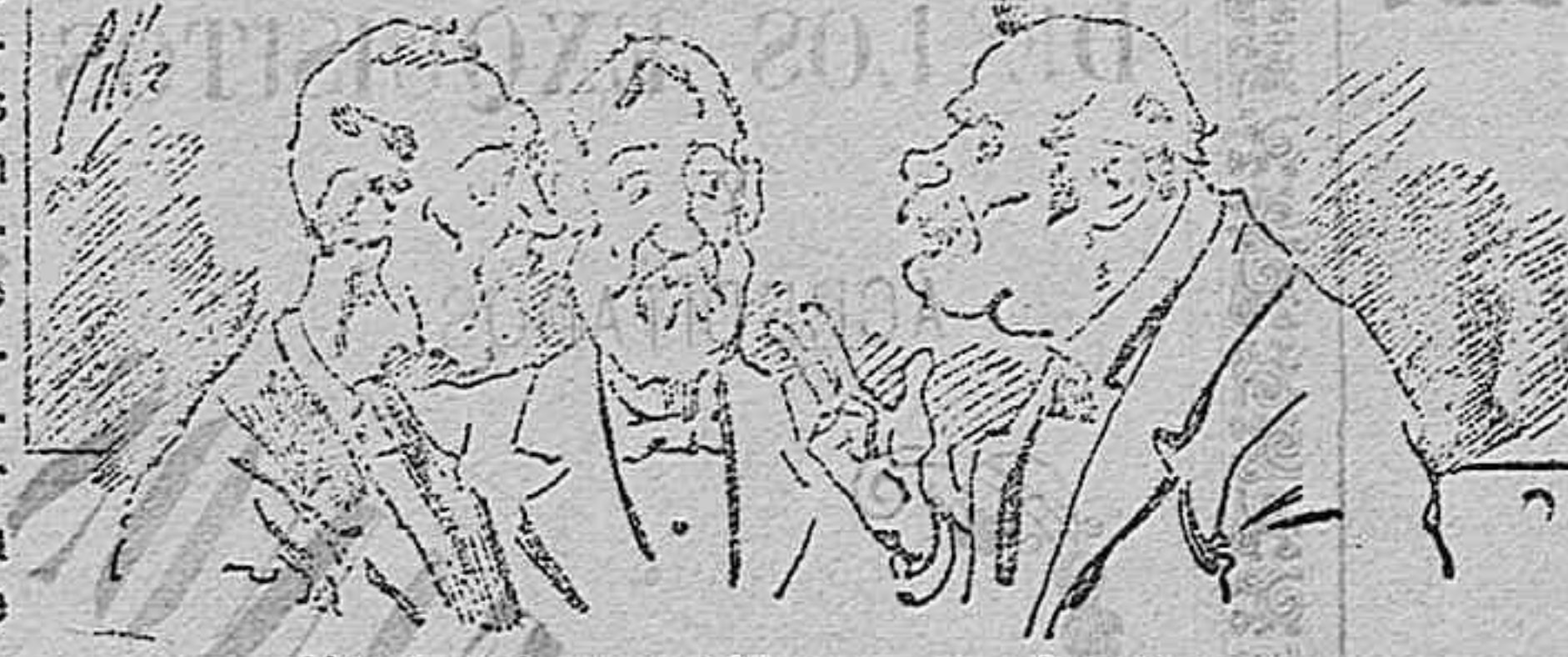
Abominan á nuestros libros....., pero los compran.

Todas las personas de gusto, curiosas é ilustradas deben pedir al Director de LA AVISPA, apartado núm. 8, MADRID, un ejemplar que se remite gratis y franqueado. Esta Revista Enciclopédica Popular publica recreaciones científicas, recetas de cocina, repostería, confitería, vinos, licores, pinturas, barnices, botines y fórmulas para toda clase de industria, y cuantas noticias y conocimientos puedan ser beneficiosos. Cuenta además con buenos grabados, parte literaria excelente; da regalos mensuales á sus lectores con la Lotería Nacional y participaciones en la misma, á cuyo efecto compra todos los sorteos, y en una de las Administraciones más afortunadas por la suerte, billetes enteros. La suscripción y los números que se nos pidan se sirven gratuitamente á correo vuelto y franqueados, con sólo indicar el nombre y dirección del que lo desea en sobre dirigido al Sr. Administrador de