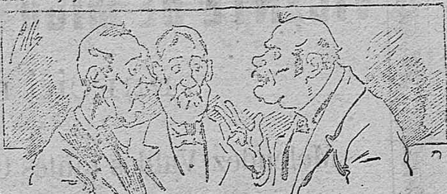
Abominan á nuestros libros..... pero los compran.

fórmulas para toda clase de industria, y cuantas noticias y conocimientos puedan ser beneficiosos. Cuenta además con buenos grabados parte literaria excelente; da regalos mensuales á sus lectores con la Lotería Nacional y participaciones en la misma, á cuyo efecto compra todos los sorteos, y en una de las Administraciones más afortunadas por la suerte, billetes enteros. La suscripción y los números que se nos pidan se sirven gratuitamente á correo vuelto y franqueados, con sólo indicar el nombre y dirección del que lo desea en sobre dirigido al Sr. Administrador de