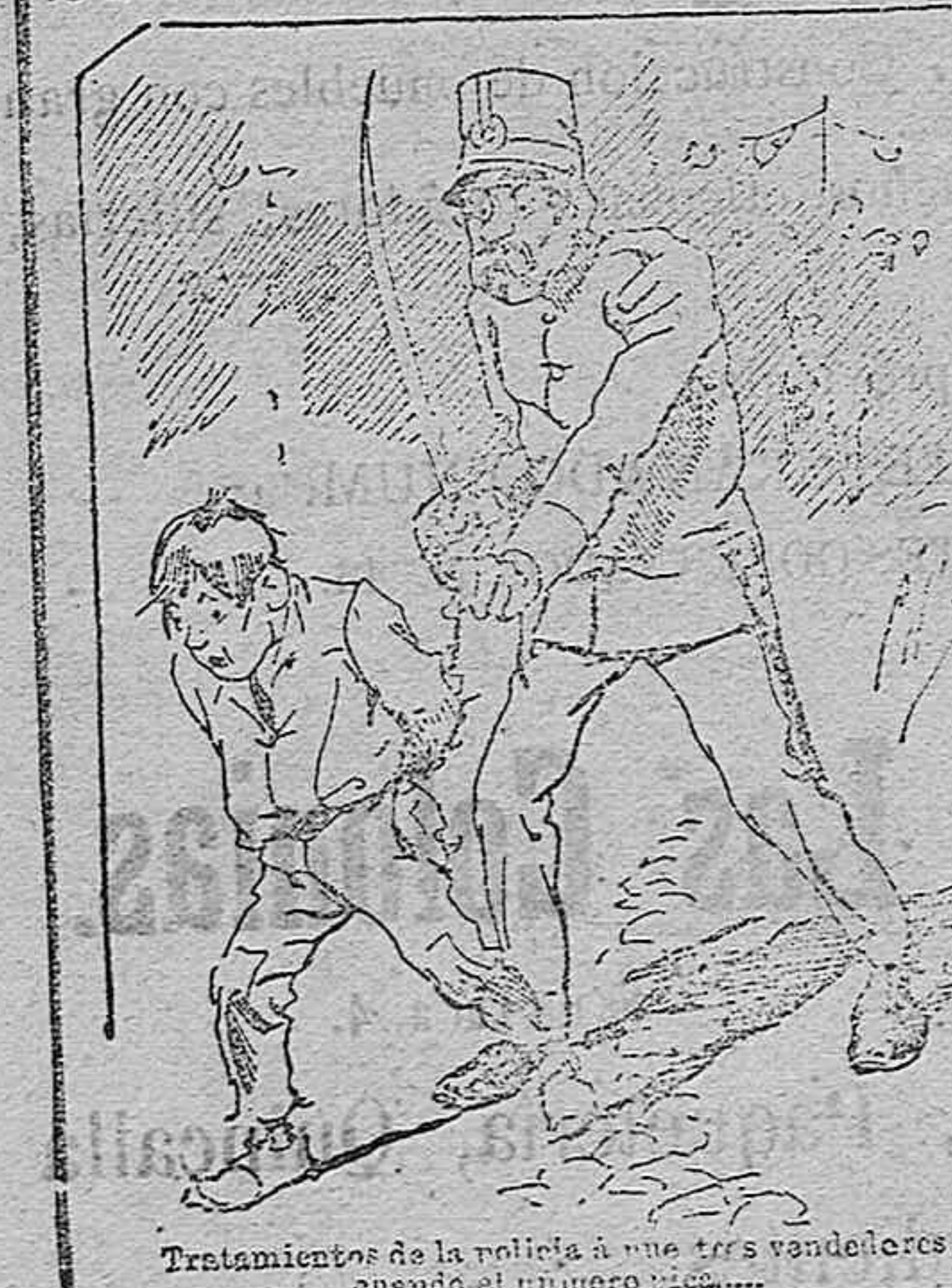
Tratamientos de la policía á sus tres vendedores cuando el número pide.....