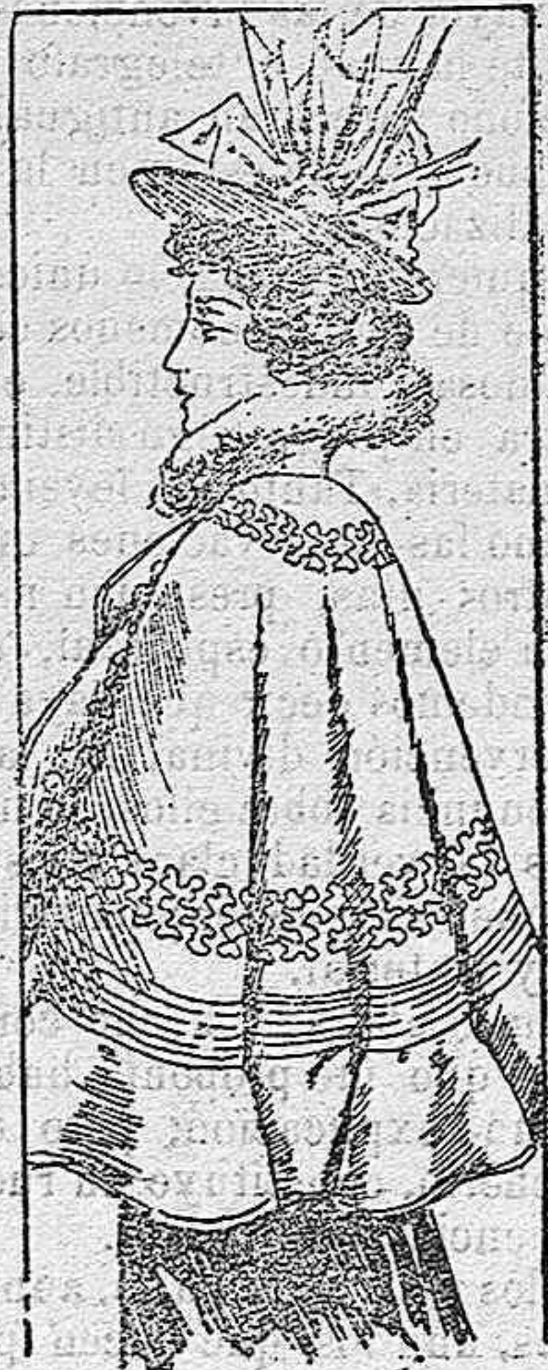
Capa para señorita.

Modelos exclusivos para nuestras lectoras, de los grandes almacenes de EL SIGLO, Barcelona (1).