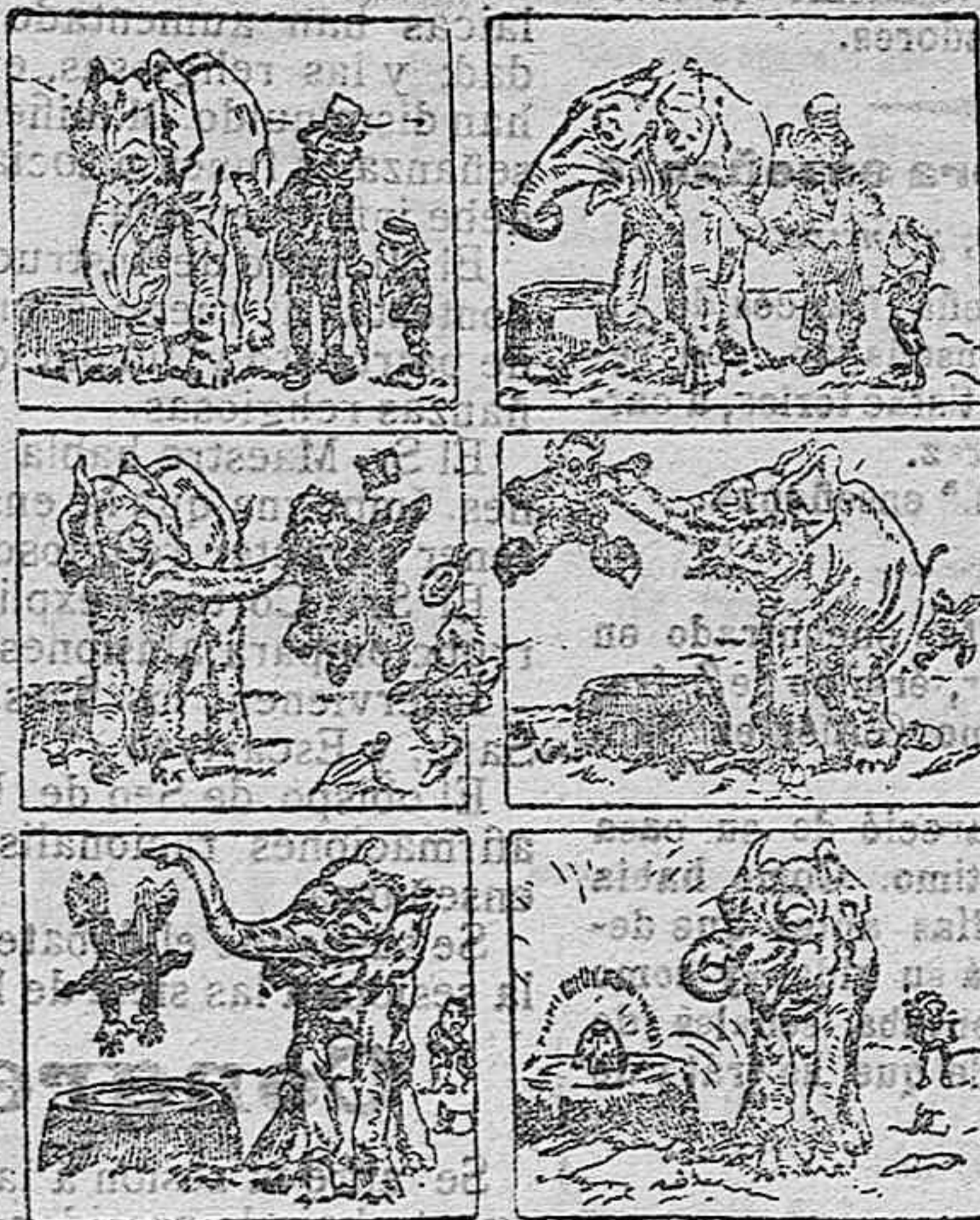
El baño del profesor