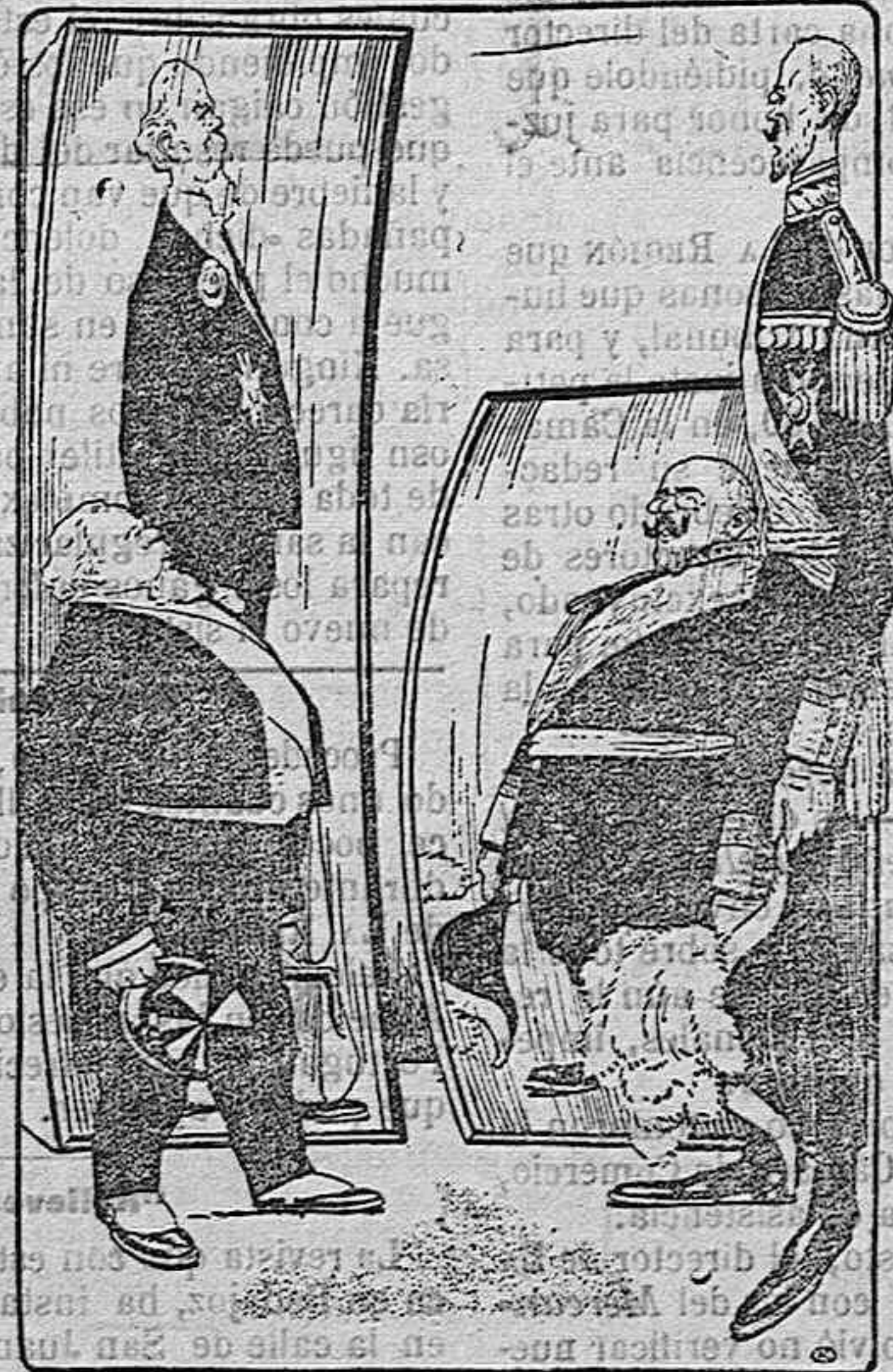
(Mirándose en los espejos grotescos.) — ¡Al fin iguales!