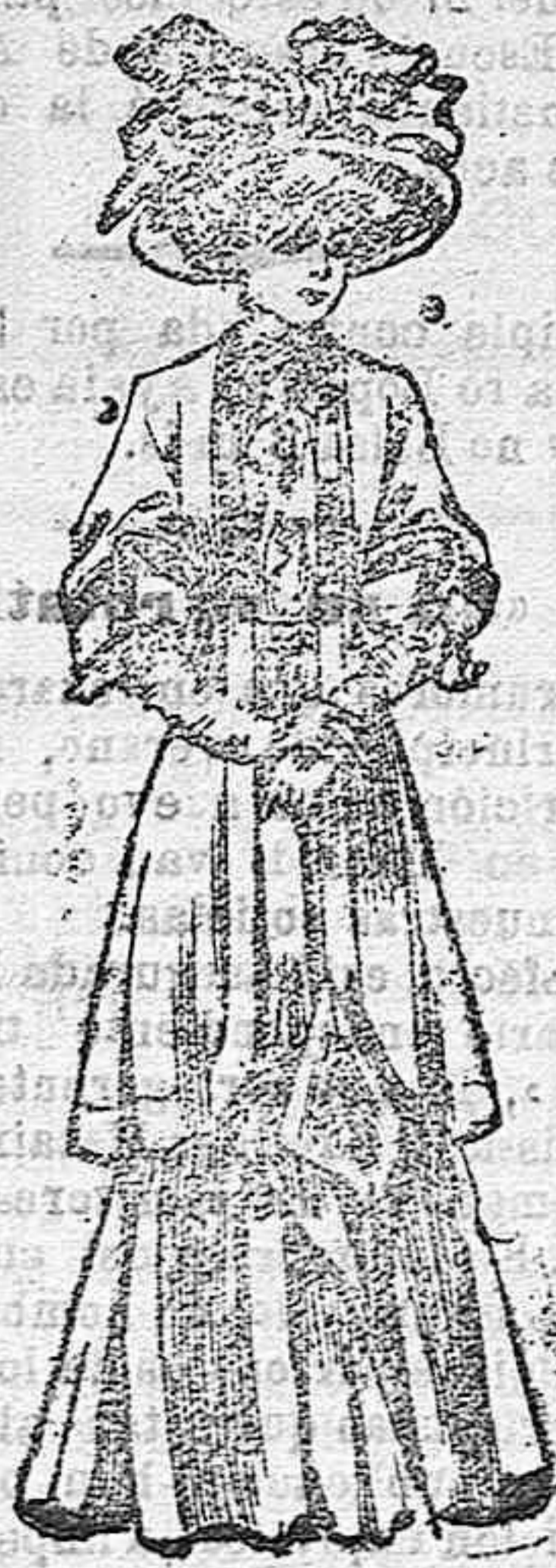
Traje para calle.—Elegante redingot

de pañete, color ceniza, adornado con tiras de terciopelo negro, tanto en el cuello como en las bocas mangas. Estas son cortas, anchas y guarnecidas con un volante de sucaje. Gran corbata de encaje y cuello de seda. Falda de lanilla ó pliegues.