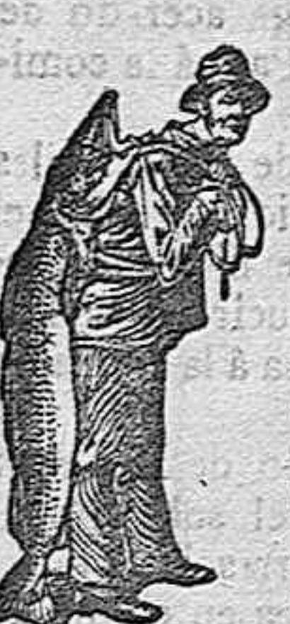
Obténase siempre la Emulsión con esta marca «El Pescador», marca del procedimiento Scott!

Cualquiera que sea el tiempo que ha estado V. tosiendo, la emulsión de SCOTT le curará la tos. Nada le curará una tós con tanta rapidez y tan permanentemente como la de SCOTT. La Emulsión SCOTT es única en su clase. Supera de mucho á todas las emulsiones similares, en poder curativo. Compre esas y malgastará su dinero. Compre la de SCOTT y se curará Vd. Ninguna otra emulsión posee tan altas recomendaciones como la de SCOTT. En todas las droguerías y farmacias.