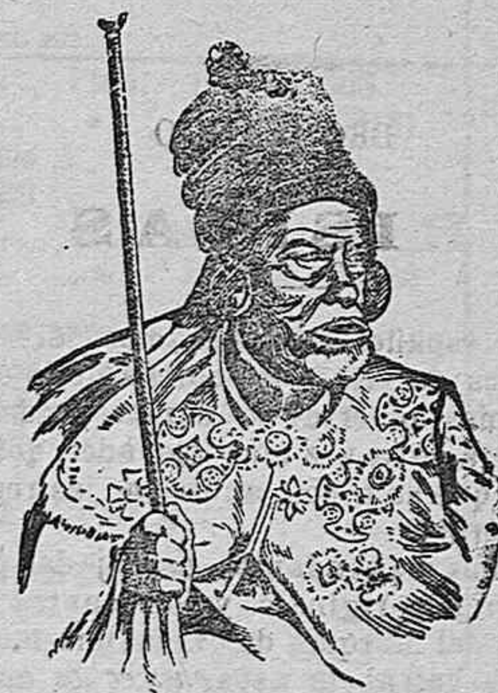
Su último retrato

De todos los soberanos reinantes es la figura de Menelik la más interesante.