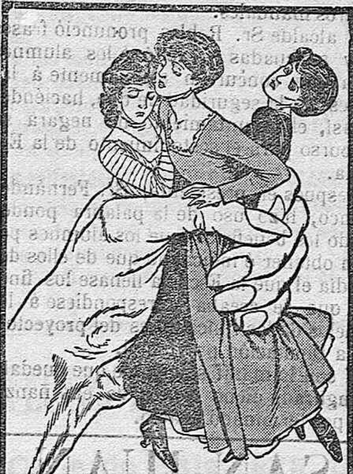
En las garras de la Anemia.

Millares de mujeres casadas, millares de jóvenes solteras, descaecen, carecientes de fuerzas, privadas de alegrías. Poco á poco la palidez mortal va descolorando sus mejillas: vélanse los ojos; languidece su andar; todas sus actitudes revelan su estado de debilidad, su agotamiento de fuerzas. Si no hacen caso de estos padecimientos empeoran y pronto se manifestarán los irremediables síntomas de la tisis.