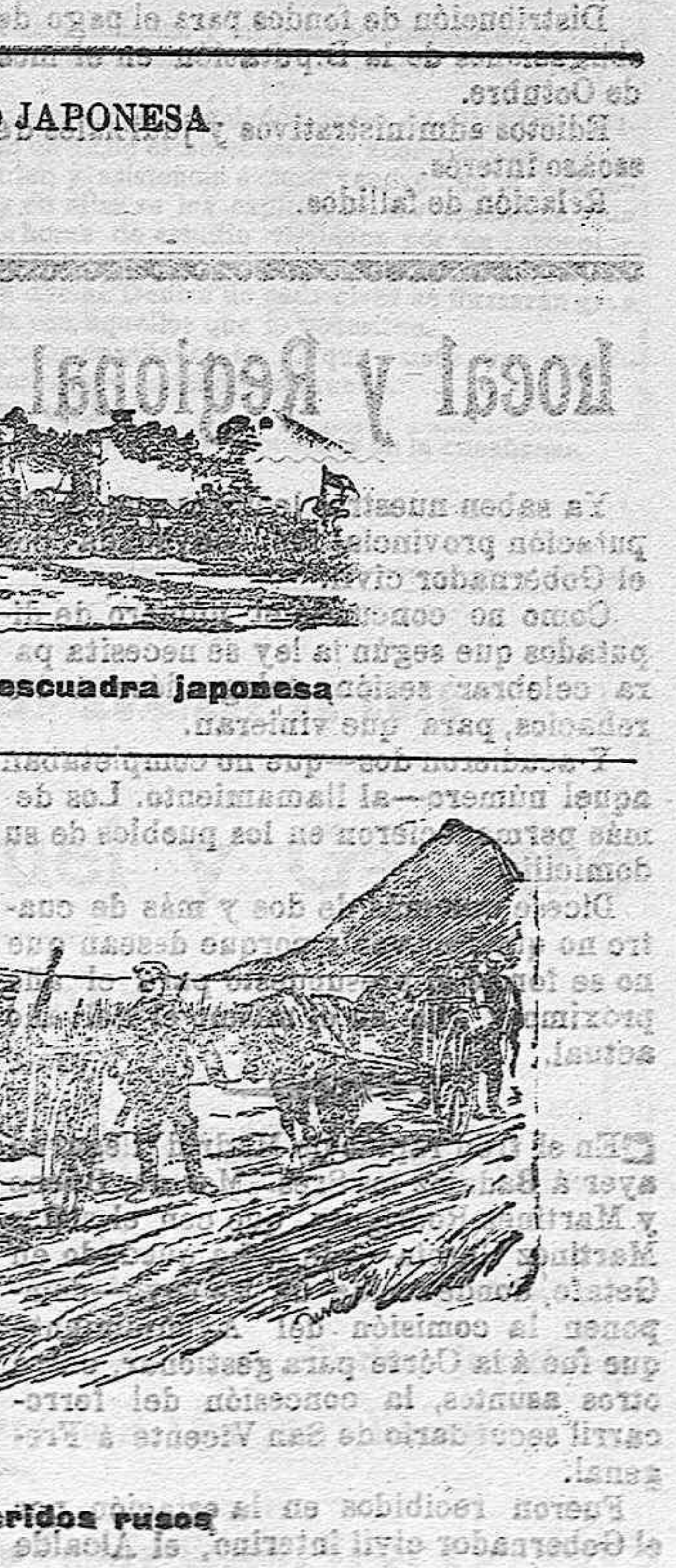
Caravana de heridos rusos