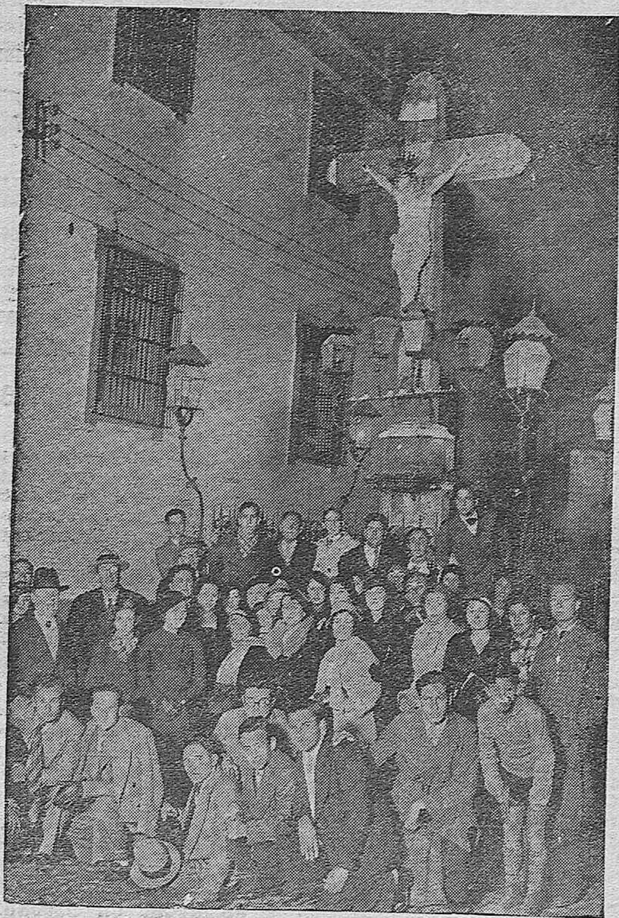
Excursión escolar.—Bellas señoritas y alumnos de la Escuela Normal de Badajoz en unión de varios profesores de dicho Centro que acaban de llegar a esta ciudad en viaje de estudios.—Los excursionistas en la Plaza de los Dolores.