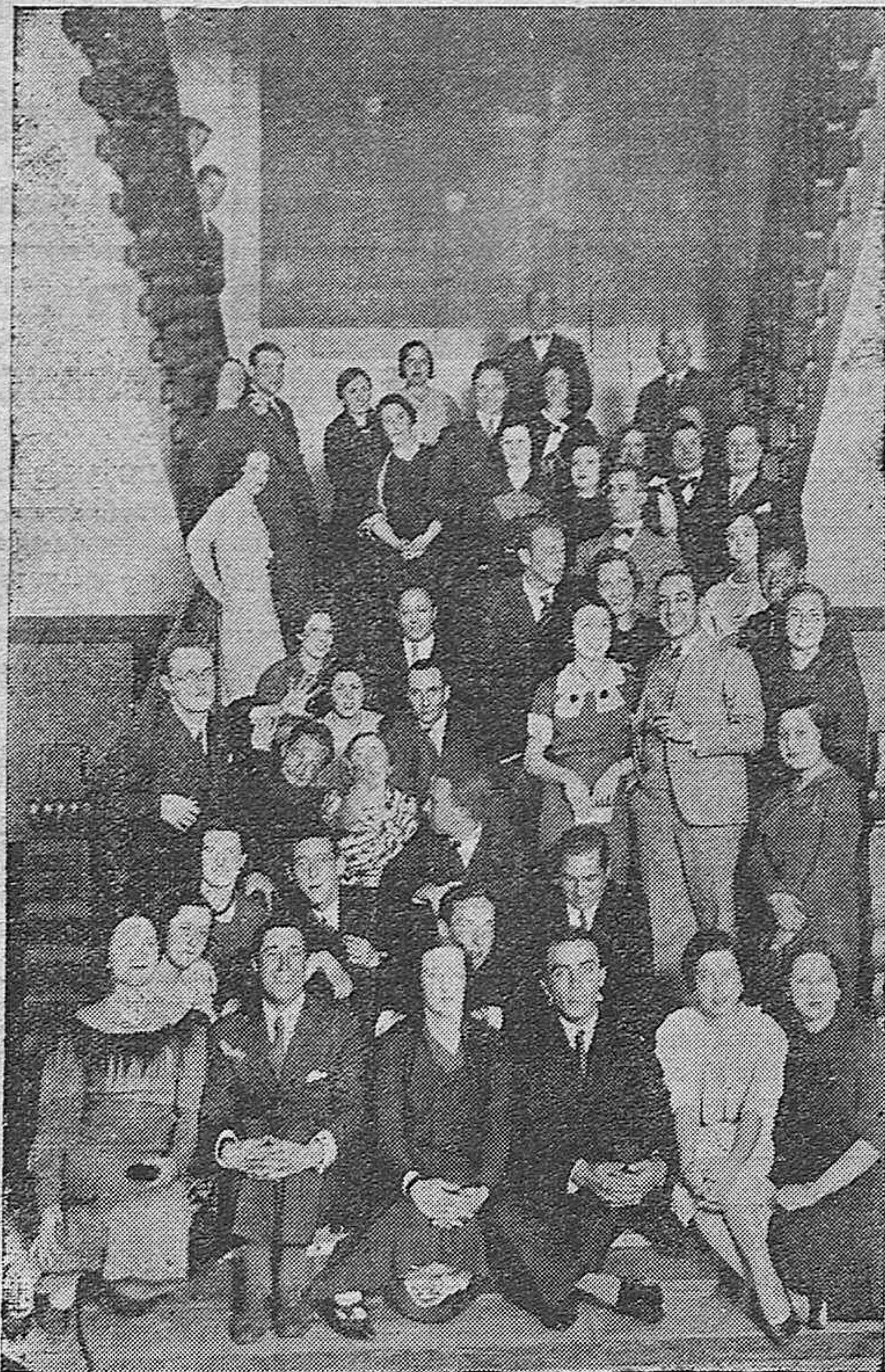
Bellas señoritas y distinguidos jóvenes que asistieron a la fiesta celebrada en el Círculo de la Amistad organizada por los socios del Law Tennis Club