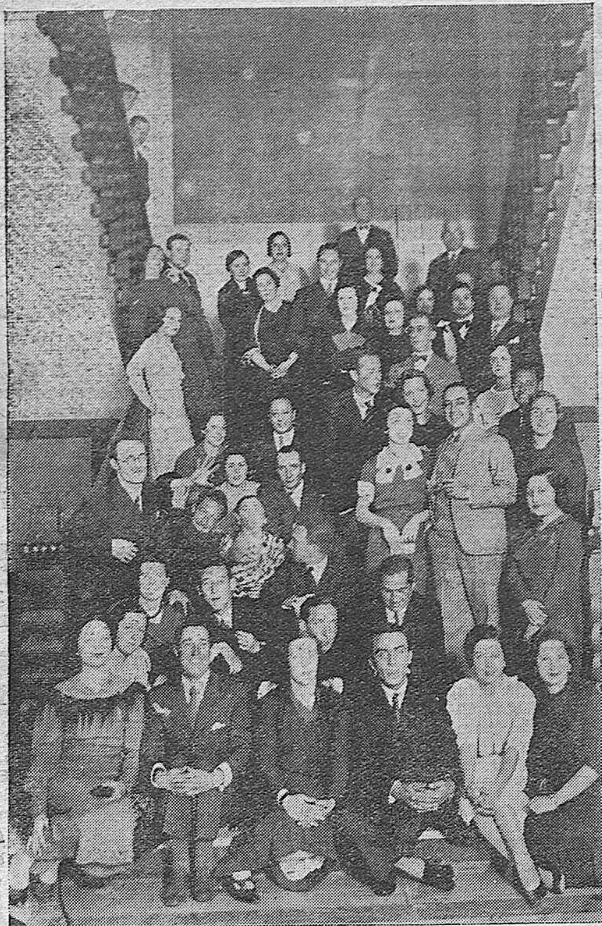
Belas señoritas y distinguidos jóvenes que asistieron a la fiesta celebrada en el Círculo de la Amistad organizada por los socios del Law Tennis Club