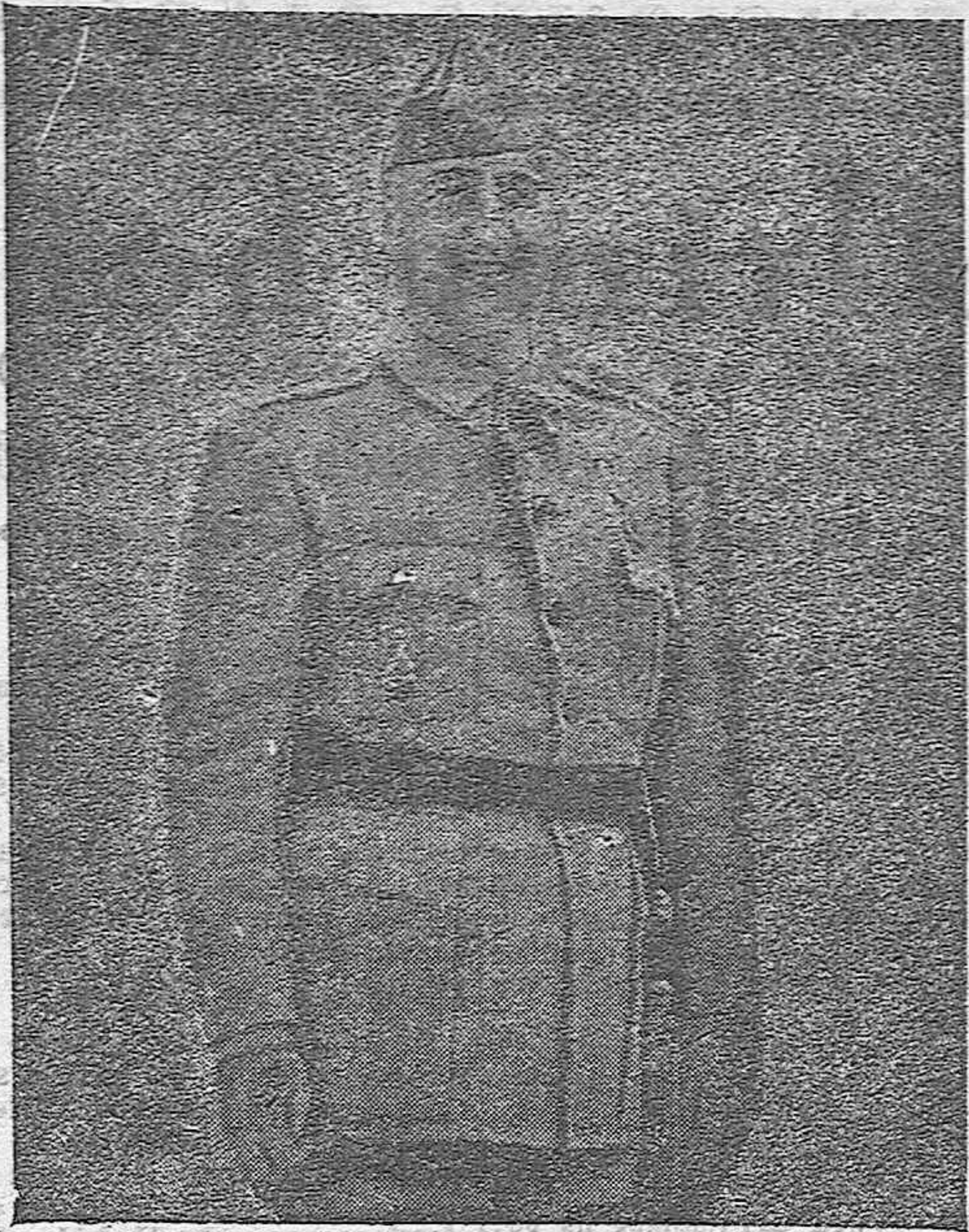
El jefe del Estado, excelentísimo señor don Francisco Franco Bahamonde, Generalísimo de los Ejércitos Nacionales y salvador del honor de España