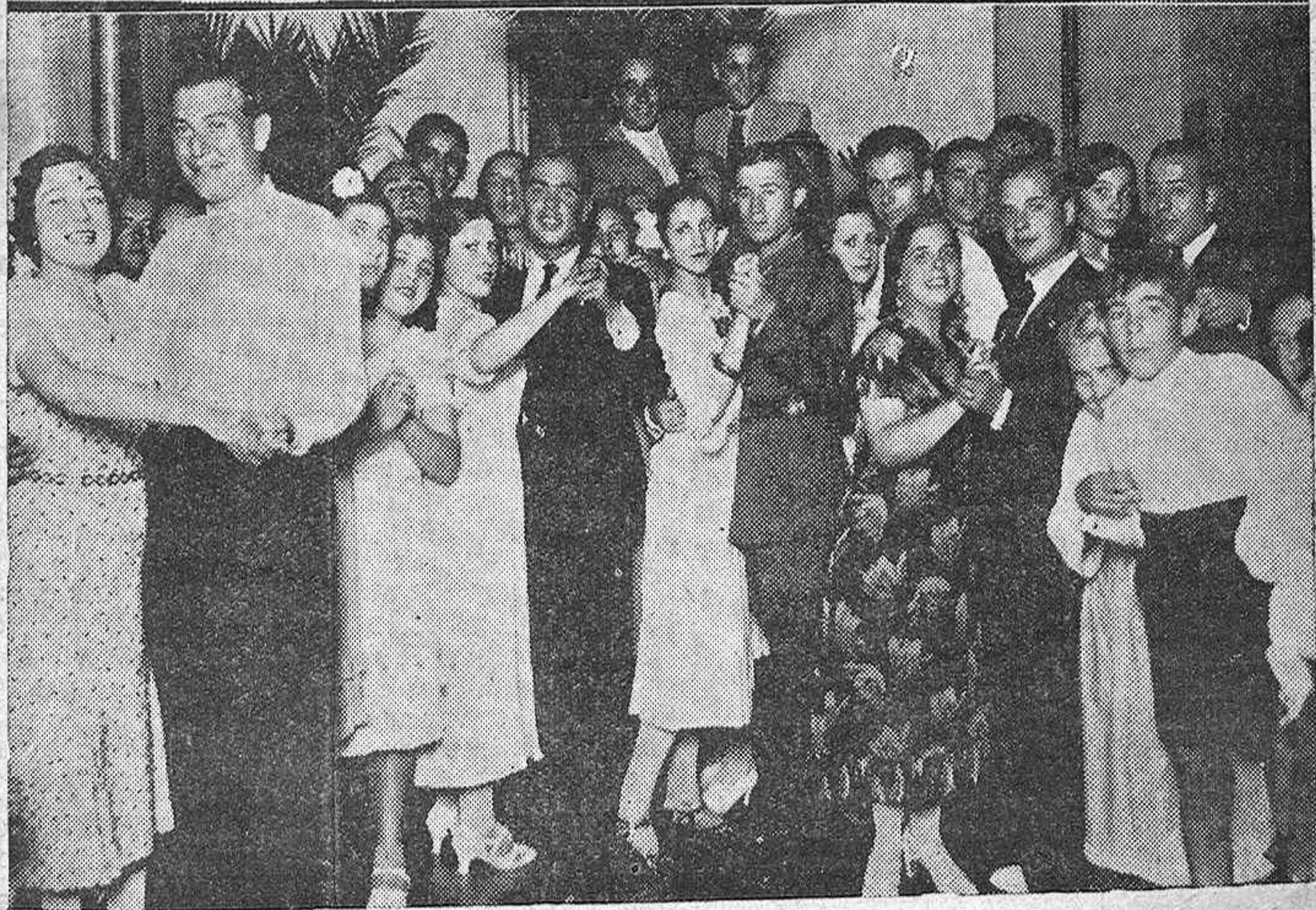
Arriba.—El gobernador civil señor Gardoqui visitando la Cooperativa Alfarera de La Rambla.—Abajo: Una de las muchas veladas juveniles en los patios cordobeses, durante las noches estivales.