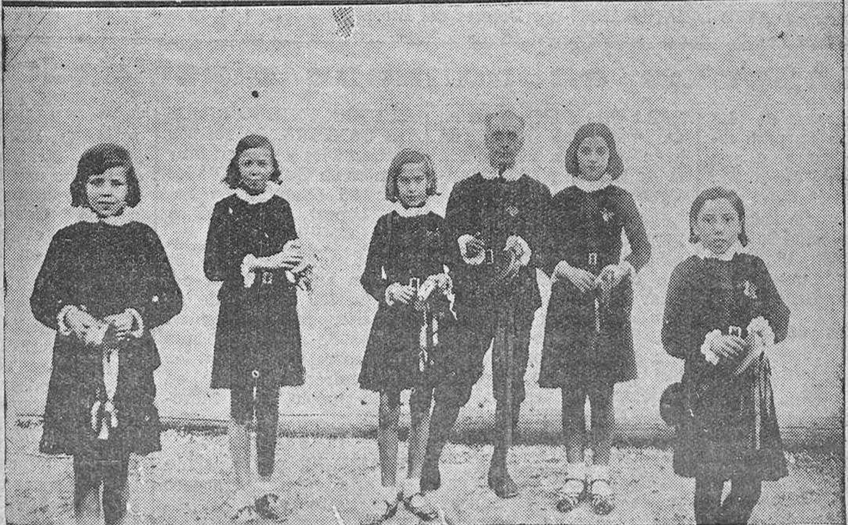
ARRIBA: Boda de la señorita Angela Nogales y el joven don Luis Gil Gómez, celebrada en la Parroquia de San Francisco.—ABAJO: Niñas panderetólogas del Centro Filarmónico "Eduardo Lucena" durante el ensayo con el maestro Prieto