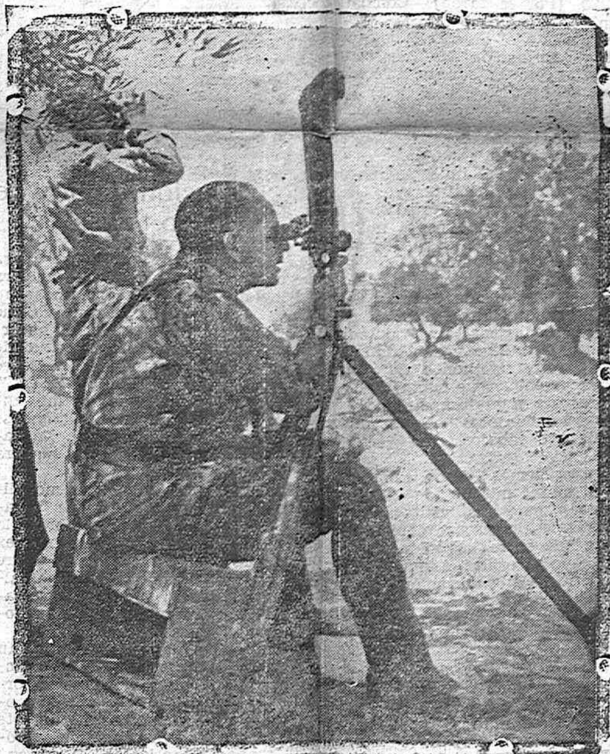
El general Varela, siguiendo el avance de nuestras fuerzas sobre Brunete