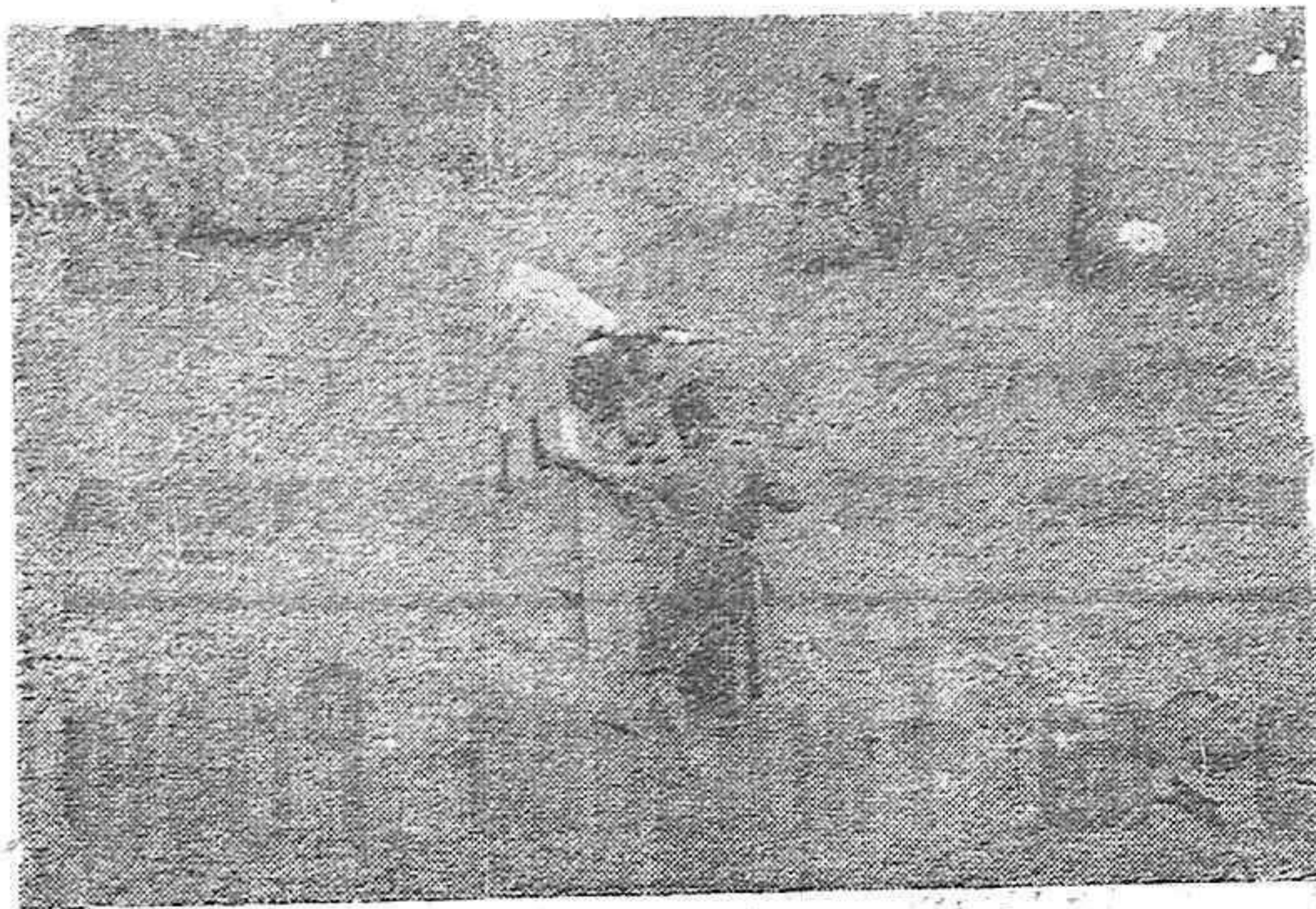
Un aspecto de la fiesta.

Nuestro periódico será servido al público en cuatro páginas tamaño 50 por 70, interín no recibamos el papel de costumbre.