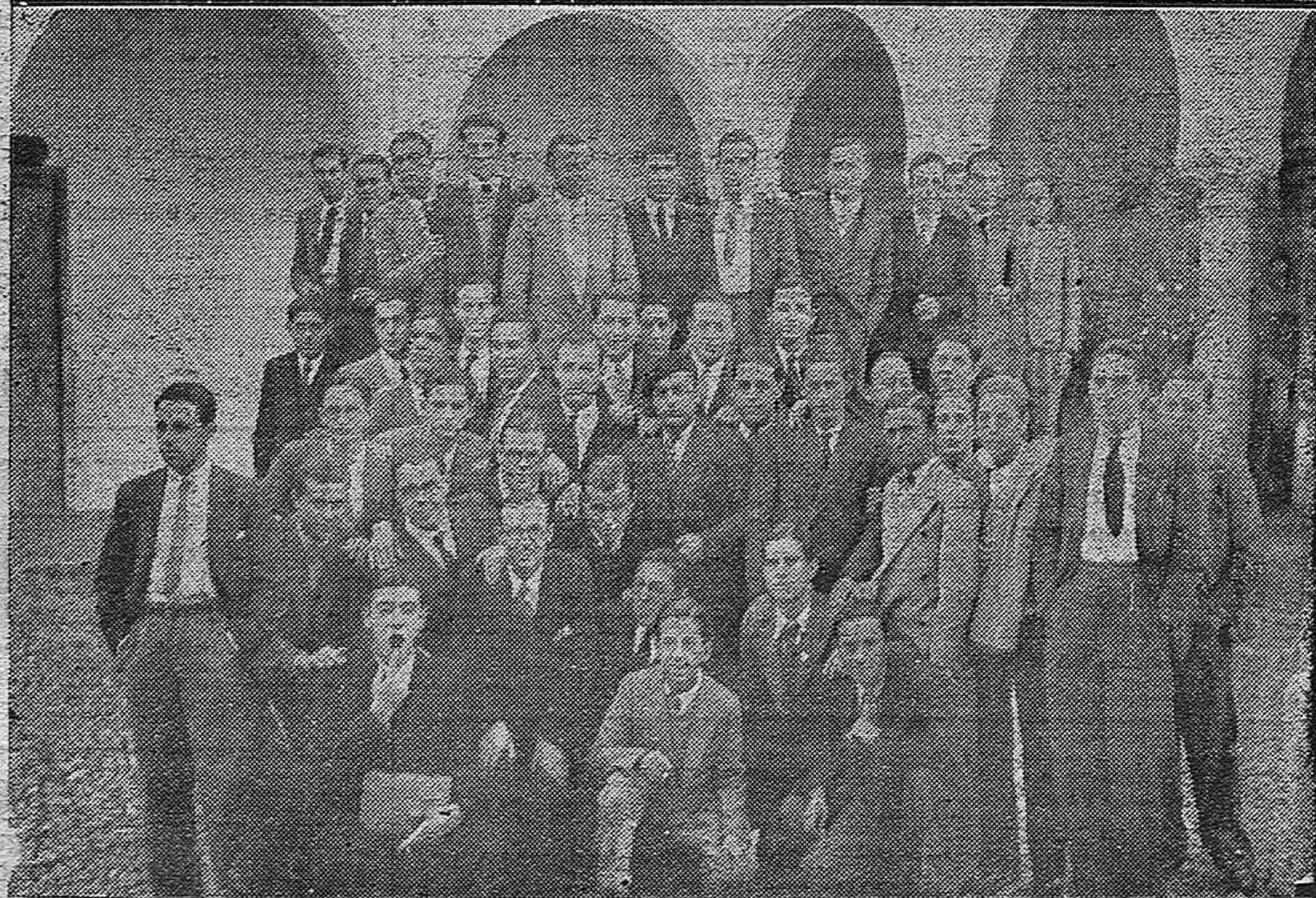
FOTAS GRAFICAS. —Los alumnos de la Escuela de Veterinaria celebraron una reunión en la que acordaron la vuelta a las clases en espera de determinadas gestiones para que continúen las obras del nuevo edificio de la Veterinaria.