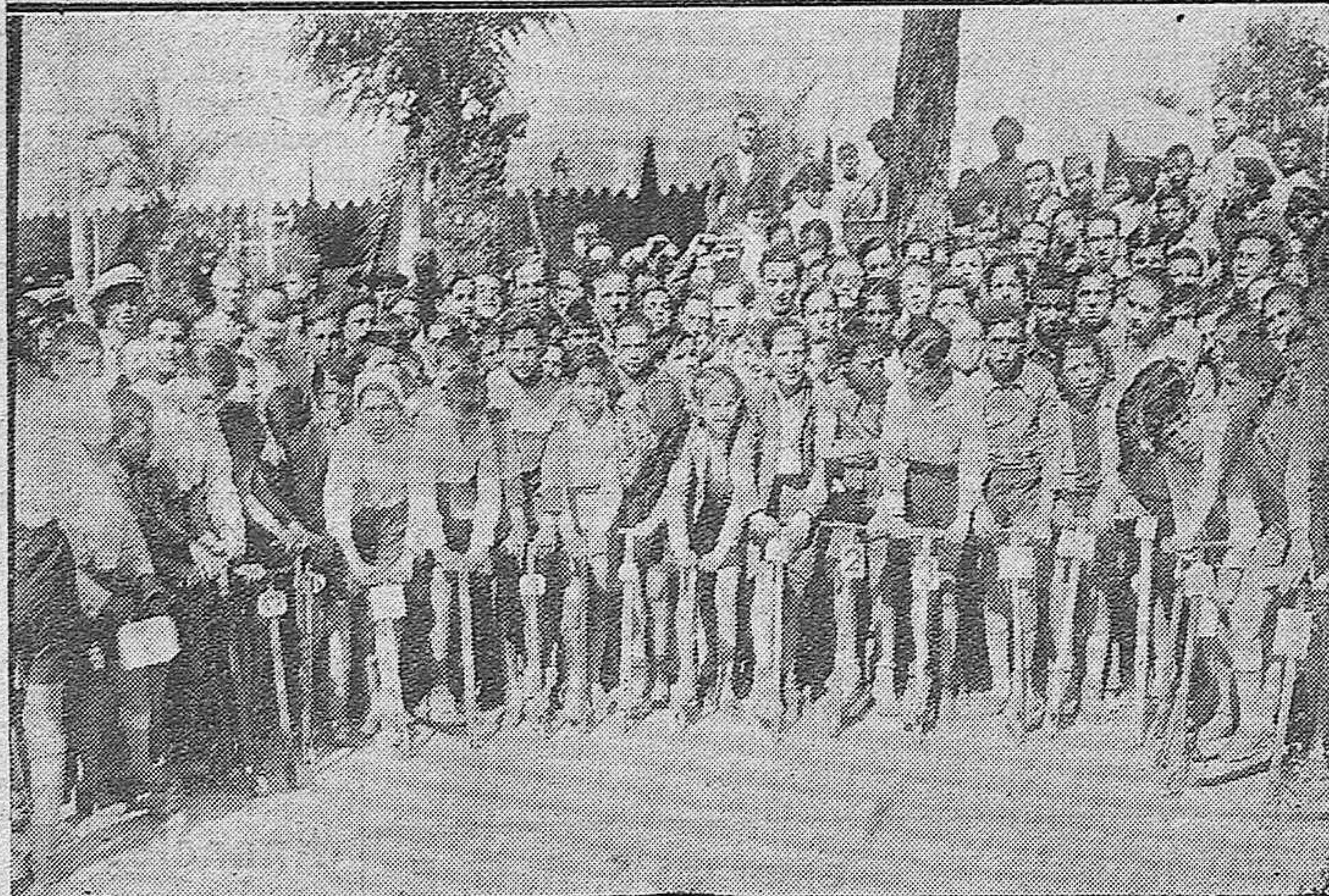
ARRIBA: Excursionistas visitando el Museo Romero de Torres.—ABAJO: Primera carrera infantil en patinetes celebrada en el Paseo de la Victoria.—Salida de los pequeños corredores.