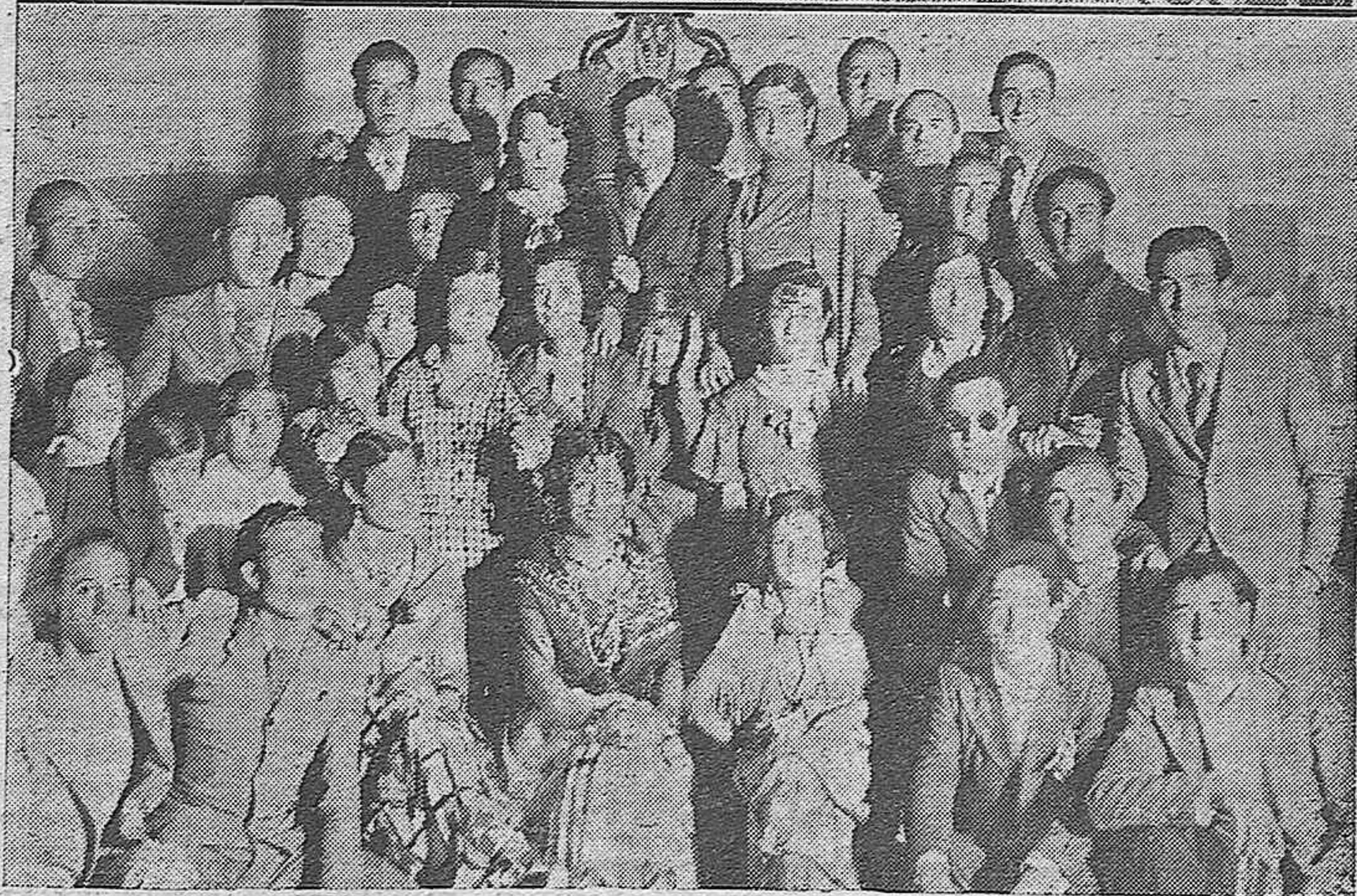
Arriba: Salida de los corredores que tomaron parte en la carrera ciclista del domingo para recorrer 100 kilómetros.—Abajo: Jóvenes que asistieron a la verbena celebrada anoche en la Huerta de la Reina.